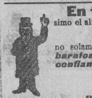
En todo Burgos y su provincia es conocido el almacén de camas y muebles de todas clases

Todos los vapores de esta importante Compañía están dotados de telegrafía sin hilos y construídos con arreglo a las necesidades y seguridad de los pasajeros.