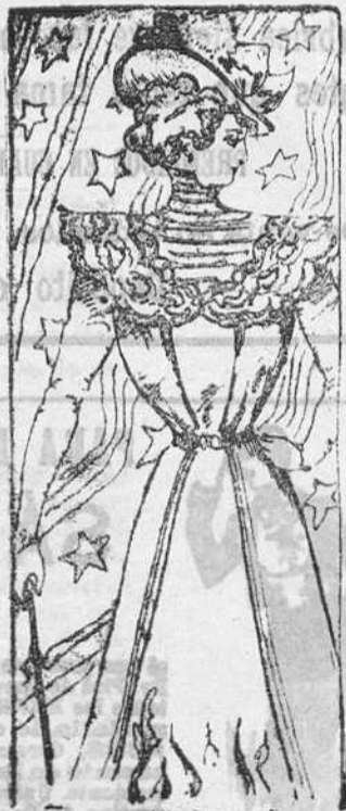
Vestido para señora

Propio para paseo. De pañete. Color liso. Cuello muy alto, de abrigo; anchos bordados sobre terciopelo. Cinturón de