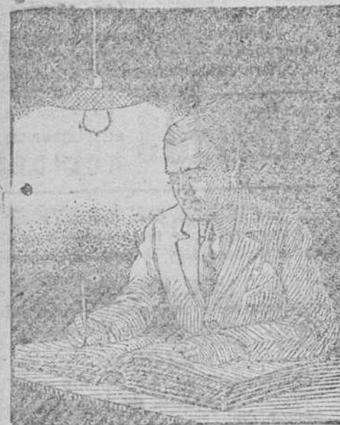
TRABAJANDO CON LÁMPARA DE FILAMENTO METÁLICO