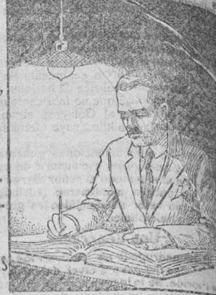
TRABAJANDO con PHILIPS ARGÁ LLENA DE GAS ARGÓN

Es inútil ocultar la verdad. Las modernas lámparas PHILIPS ARGÁ sustituirán en breve plazo las de filamento metálico, que ya no convienen.