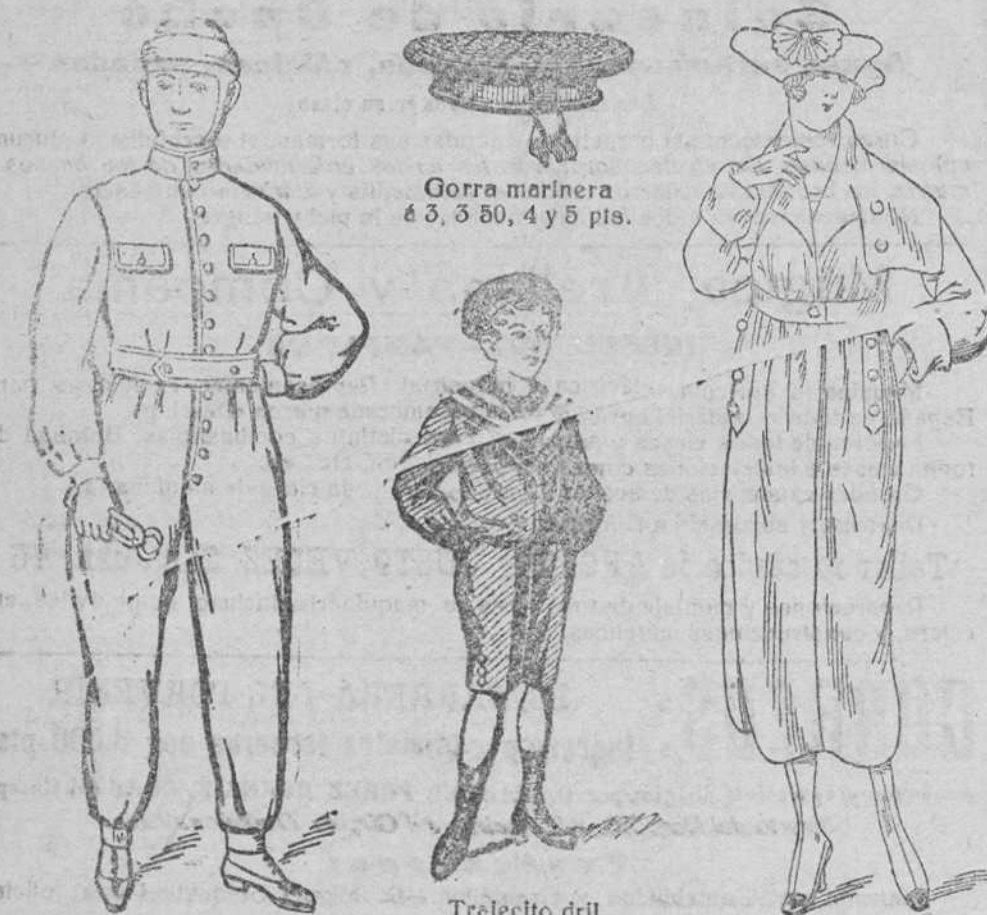
Gorra marinera á 3, 3 50, 4 y 5 pts.

Plaza Mayor, 42, y Lain-Calvo, 9.-Teléfono núm. 88.-Burgos