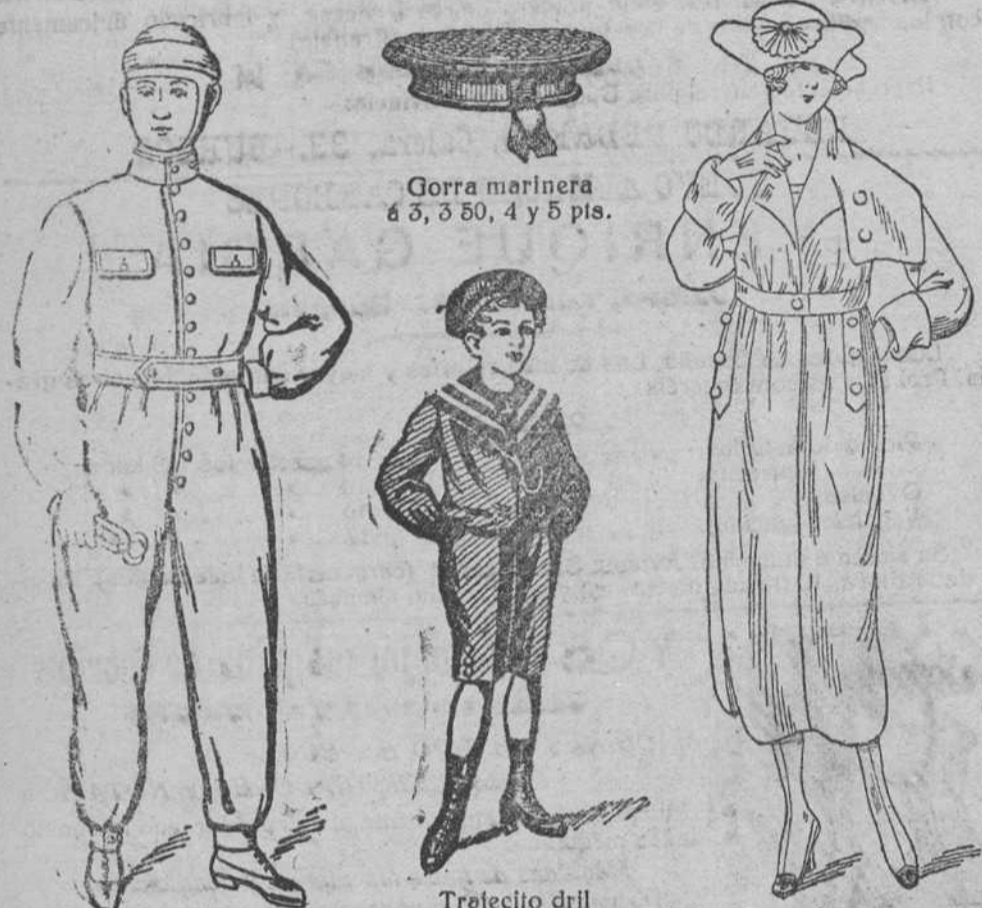
Gorra marinera á 5, 3 50, 4 y 5 pts.

Plaza Mayor, 42, y Lain-Calvo, 9.-Teléfono núm. 88.-Burgos