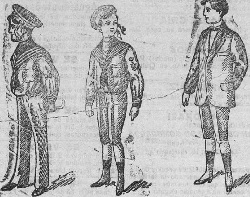
Trajecitos de vicuña á 15, 18, 20 y 25 pesetas De gerga azul á 25, 30, 35 y 40 pesetas

CASA MUNGUA. (Sucesor de Rebollo) Plaza Mayor, 42, y Lain-Calvo, 9. — Teléfono núm. 88. — Burgos