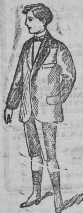
Traje para joven a 35, 40, 50, 60 y 70 pesetas.

Plaza Mayor, 42 y Lain-Calvo, 9 TELEFONO 88 :: BURGOS.