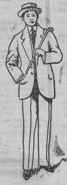
Traje paño melton a 45, 50, 60, 70 y 90 pesetas.