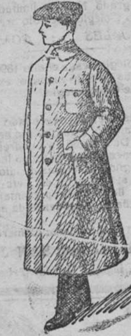
Guardapolvos caballero a 12, 15, 18, 20 y 25 pesetas.