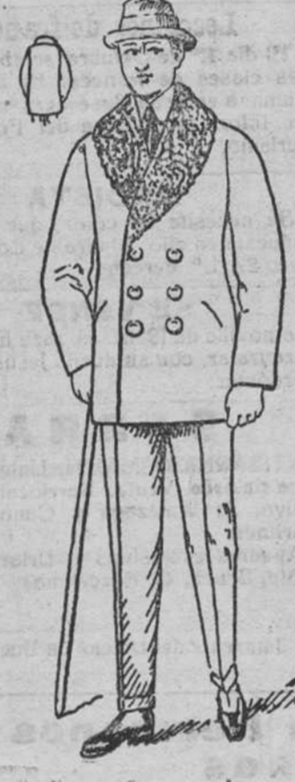
Peliza paño arasado, con piel ó rizo en el cuello, a 40, 50, 60 y 70 pesetas.