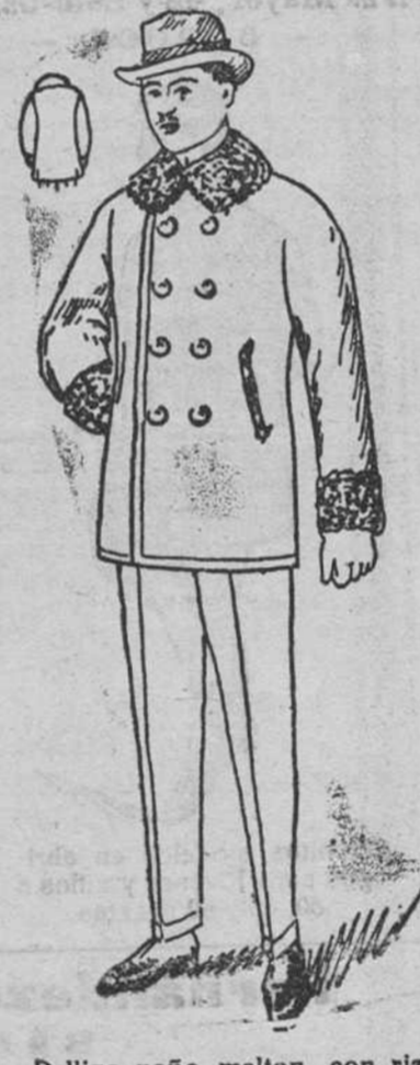
Peliza paño melton, con rizo en el cuello y puños, a 25, 30, 40, 50 y 60 pesetas.