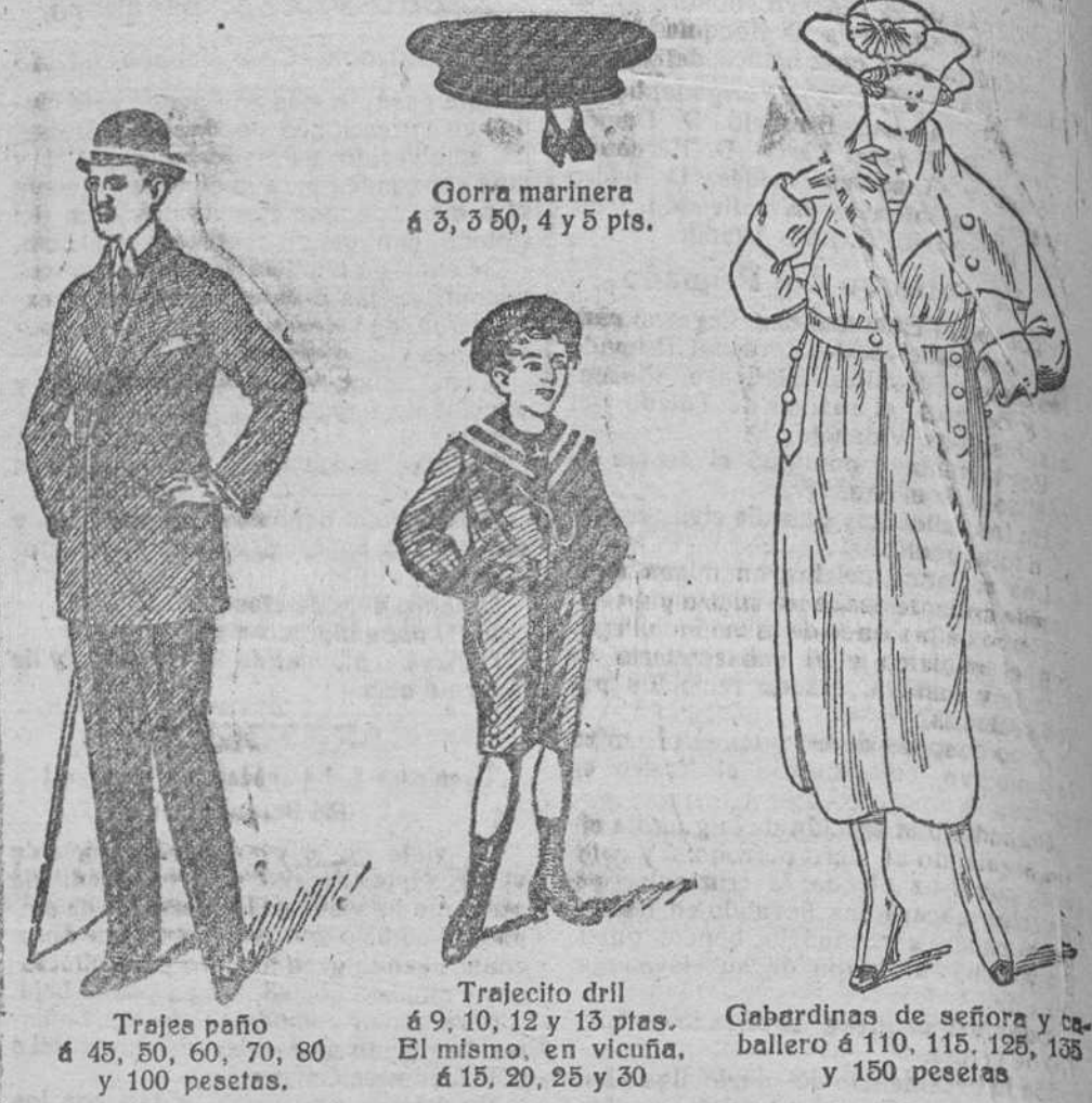
Gorra marinera á 3, 3 50, 4 y 5 pts.

Plaza Mayor, 42, y Lain-Calvo, 9.-Teléfono núm. 88.-Burgos