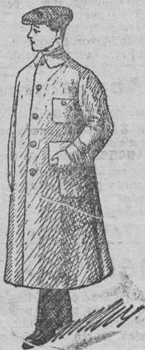
Guardapolvos caballero á 12, 15, 18, 20 y 25 pesetas.