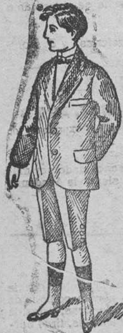
Trajecito para joven á 35, 40, 50, 60 y 70 pesetas.

Plaza Mayor, 42 y Lain-Calvo, 9 TELEFONO 88 :: BURGOS.