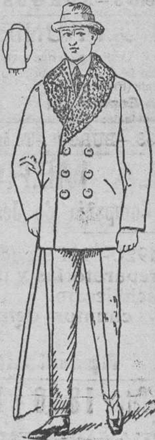
Peliza paño erasado, con piel ó rizo en el cuello, á 40, 50, 60 y 70 pesetas.