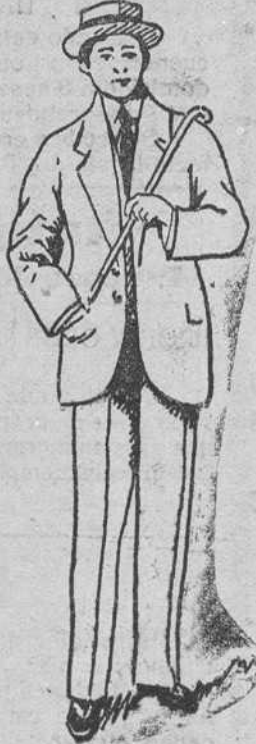
Traje paño melton á 45, 50, 60, 70 y 90 pesetas.