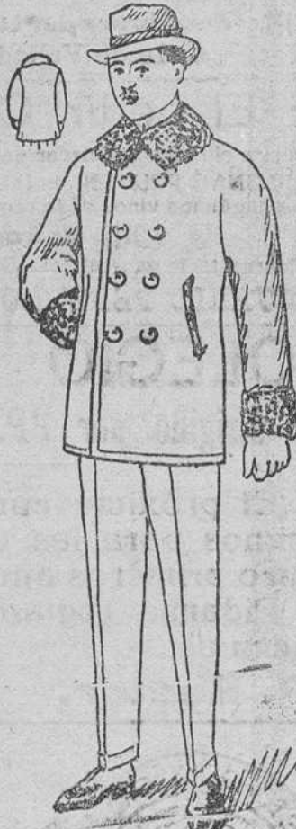
Peliza paño melton, con rizo en el cuello y puños, á 25, 30, 40, 50 y 60 pesetas.