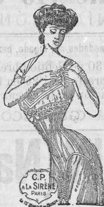
C.P. LA SIRENE PARIS