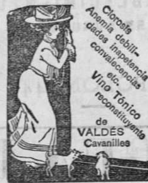
Choriza Avenida de la dada la convalencia etc. Vino Tónico de VALDÉS Cavanilles

Esta Compañía universal, que tiene agencias en todas partes, es muy liberal en sus pólizas y en el arreglo de siniestros, que tramita muy rápidamente. Sucursal Española, Alcalá, 66, MADRID