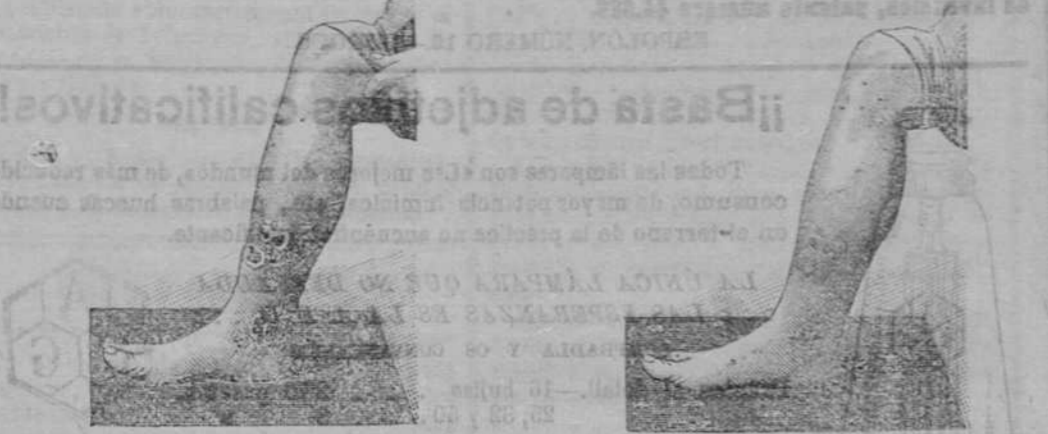
Antes de la curación. Después de 15 días de tratamiento.

Descubrimientososensacional. Curación de las enfermedades de la piel y también de las llagas de las piernas