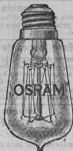
Toda lámpara «Osram» legítima lleva la marca «OSRAM» grabada en el cristal.