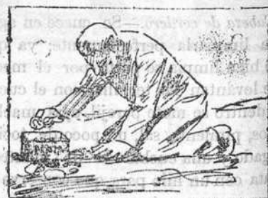
Solución al jeroglífico: