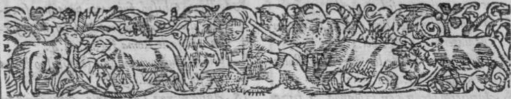
TABLA DE LAS