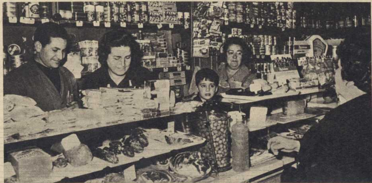
A PIQUER le «empujan» sus hijos tras el mostrador, pero él se encuentra más a gusto ante los toros que atendiendo a la clientela.