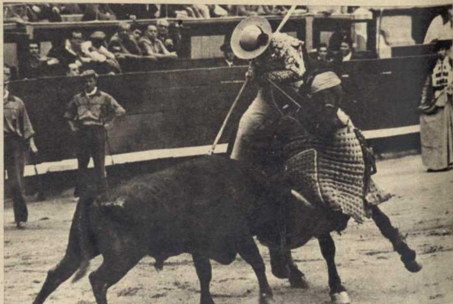
CASTIGO.—Malagueño, en un momento de actuación, castigando a un toro en la plaza Monumental la pasada temporada.