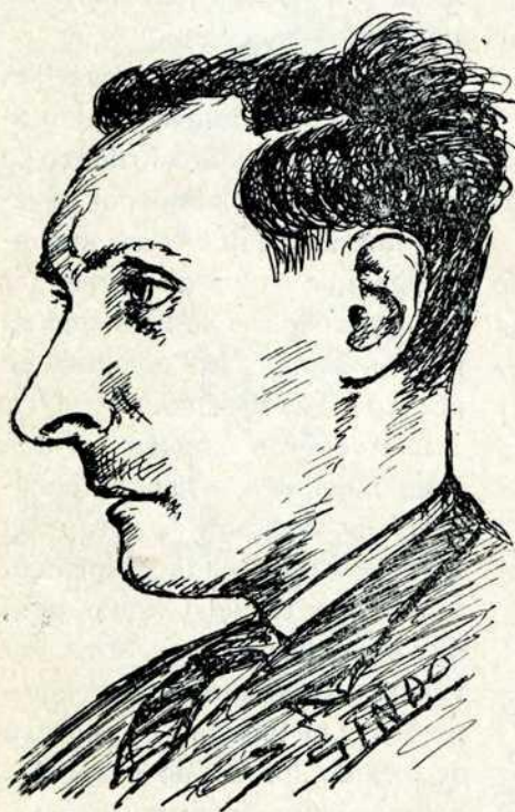
(Dibujo de Pedro Donis).

La figura la tiene poco agarbada y avanza cuatro metros de una zancada. Pero es Barbero una buena persona y un caballero.