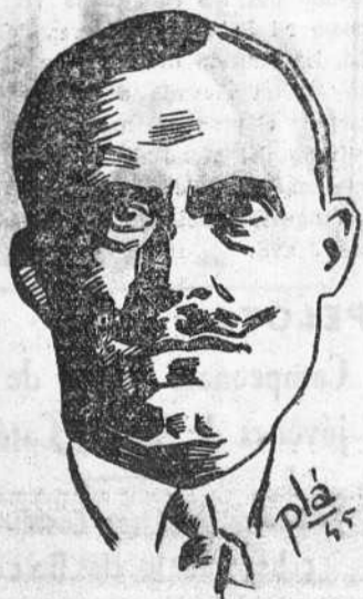
GENERAL PLASTIRAS, PRESIDENTE DEL CONSEJO GRIEGO

Los monárquicos griegos esperan alcanzar mayoría en el plebiscito