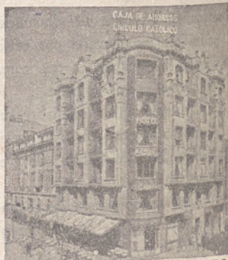
SUCURSAL - Espolón, 32 (ENTRADA POR EL HONDILO)