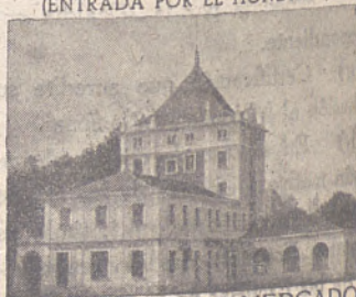
SUCURSAL DEL MERCADO DE GANADOS DE S. AMARO