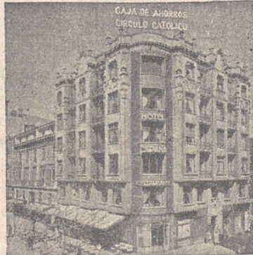
SUCURSAL - Espolón, 32 (ENTRADA POR EL HONDILLO)