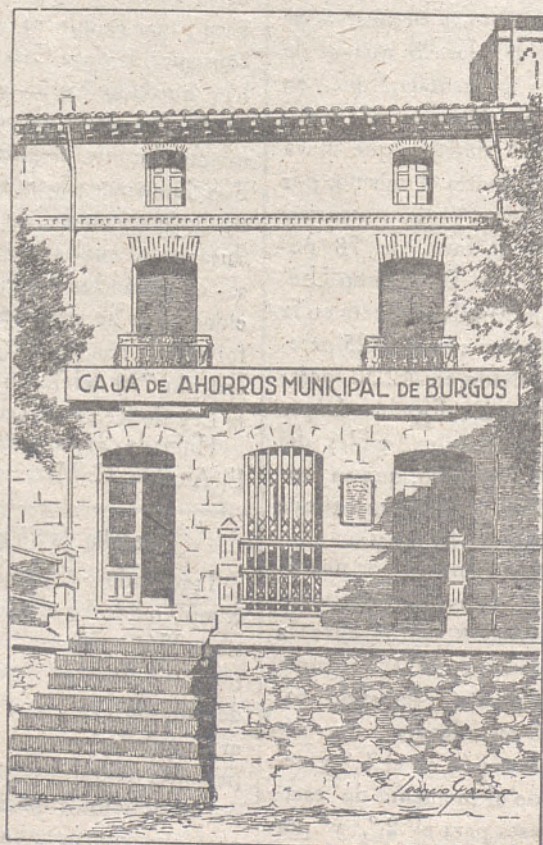
Agencia de la Caja de Ahorros Municipal, en Lerma

Créditos con garantía personal al 5,50 % de interés anual. Créditos especiales para adquisición de tierras, maquinaria agrícola y mejoras de la agricultura al 3,75 % de interés anual