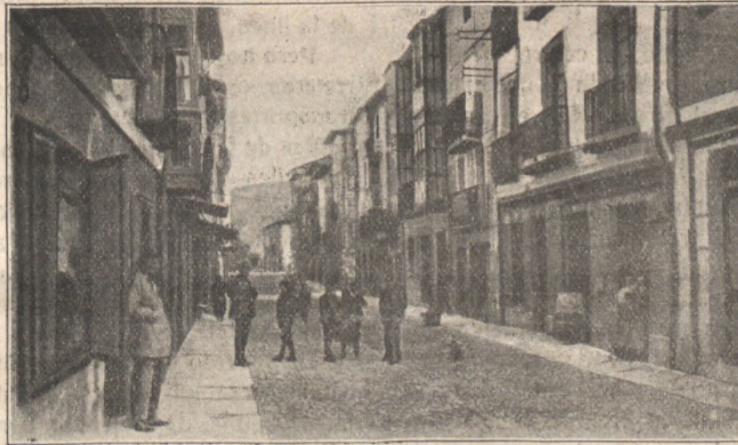
Calle de D. Justo Cantón Salazar