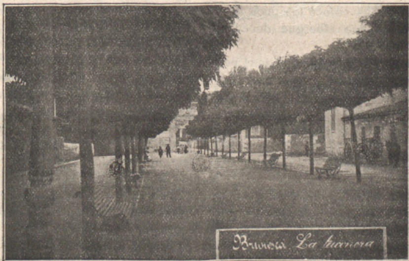
Barriada La Llanera

Esas horas las vamos a dedicar a construir materiales fáciles y adaptables para la fabricación de una casa. Adobes, teja, ladrillo, mortero, acoplar arenas y grava del río.