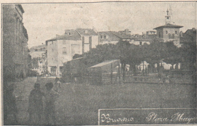
Briviesca Plaza Mayor