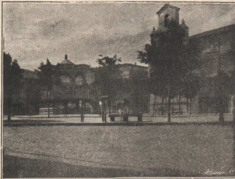
LA PLAZA MAYOR