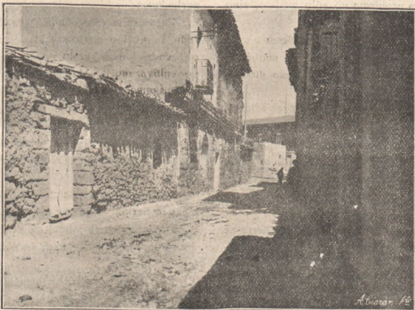
La famosa casa donde se celebraron las Cortes de Briviesca en el reinado D. Juan I.

Con fruición le clasifica de magnificante de suntuoso, de maravilla, encomiando entusiásticamente a sus artífices, Diego Guillén y Pedro López de Gámiz y repite con Amador de los Ríos,