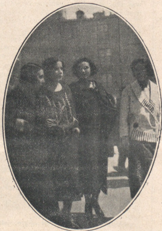
....El paseo de muchachas en estas tardes de suaves caricias estivales es altamente simpático....