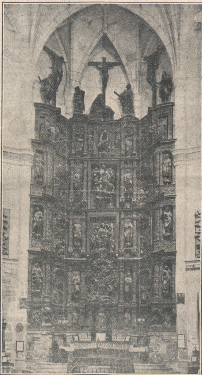
RETABLO DEL ALTAR MAYOR DE SANTA CLARA