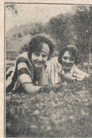
....esas lindas mujercitas que embellecen tan típicos lugares.....