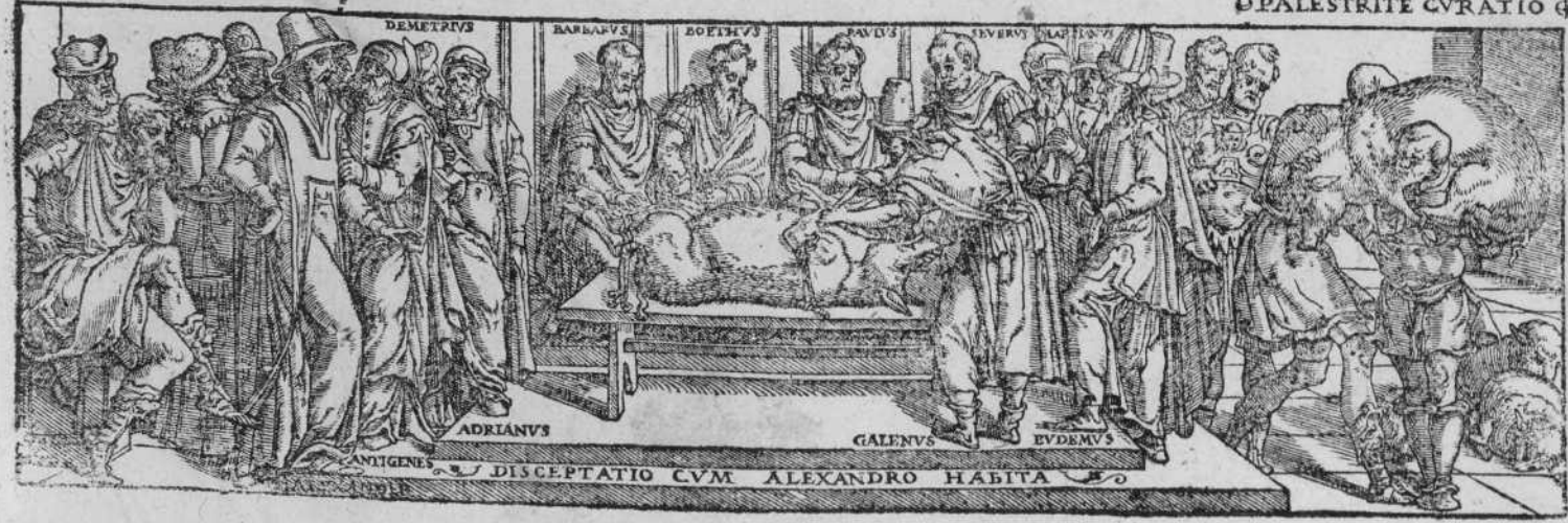
DISCEPTATIO CVM ALEXANDRO HABITA