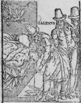
CRISIS PRÆCOGNITIO C