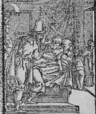
HEPATICI COGNITIO C