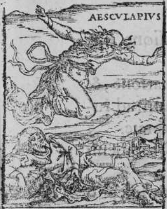
PATRIS INSOMNIUM G