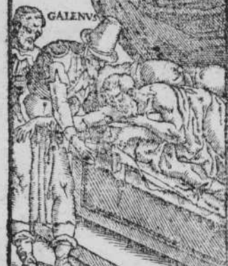
PALESTRITE CVRATIO C