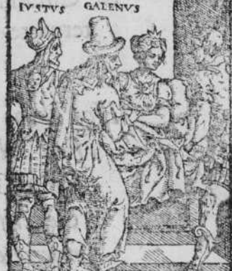
AMANTIS DIGNOTIO C