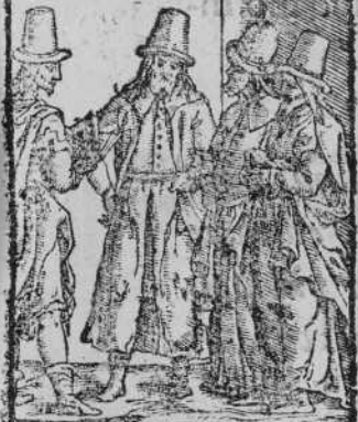
GALENI DOCTORES C