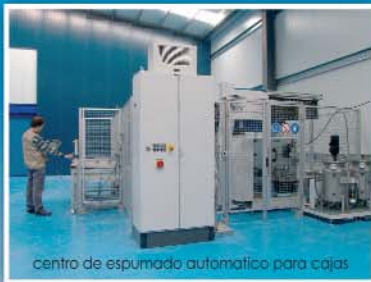
centro de espuma automática para cajas