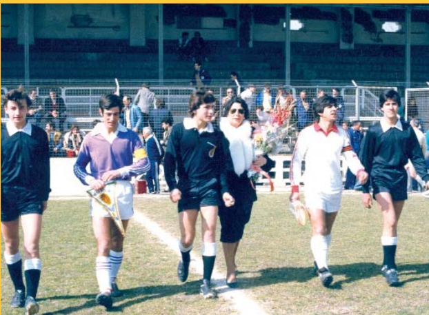
En el viejo Zorrilla