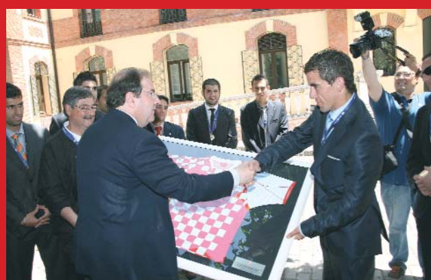
Con Juan Carlos Aparicio, Alcalde de Burgos