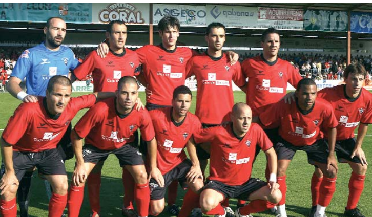
Once Inicial del Primer Partido en casa frente al Eibar

Mientras el Mirandés cumple ya su undécima temporada en Segunda B. Logró el ascenso tras cuatro en Tercera y múltiples intentos de alcanzar la categoría de bronce del fútbol español. Tras acabar segundo del grupo VIII de Tercera, tuvo que hacer frente a una larga Fase de Ascenso, en la que eliminó con solvencia a La Muela (1-3 y 4-1) y al Peña Sport (4-0 y 0-1) en las dos primeras eliminatorias, para jugarse el ascenso ante el Jerez Industrial.