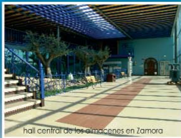
hall central de los almacenes en Zamora