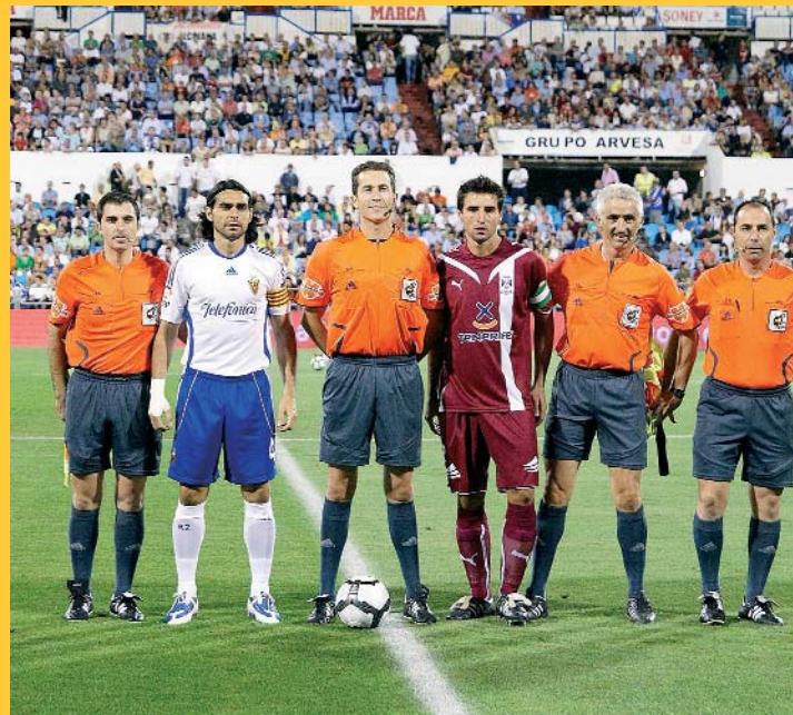
"Partido de debut en Primera División, Zaragoza - Tenerife.

La verdad es que no sabía cuantos árbitros de Castilla y León habían llegado a la Primera división, entrar en esa lista de privilegiados es algo que me enorgullece.