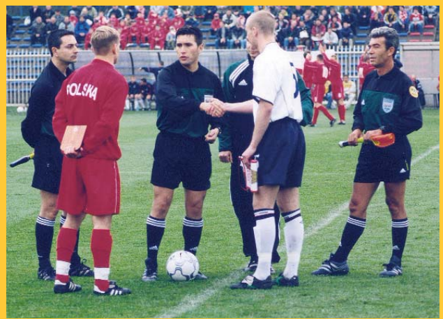
Debut internacional Polonia - Inglaterra Sub21 en 2001