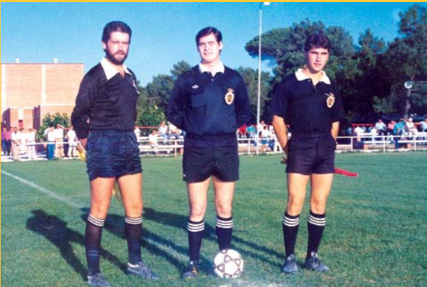
En el campo municipal de Pedrajas