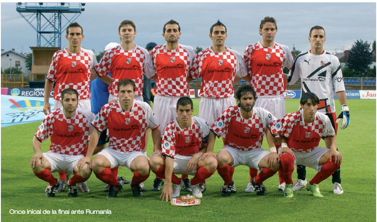
Once inicial de la final ante Rumanía

Castilla y León conquistó la VI Copa de las Regiones de UEFA el 22 de junio de 2009. El máximo trofeo existente para una Selección Autónoma. No consta competición oficial de mayor nivel para un combinado amateur. La primera vez que Castilla y León participó en competición internacional, se llevó el gato al agua.