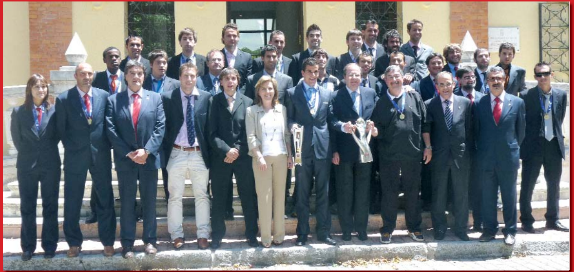
Con el Presidente de la Junta de Castilla y León y la Consejera