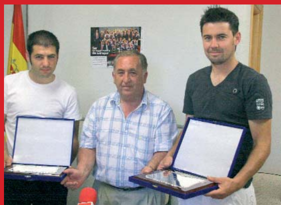
En la Delegación de Segovia