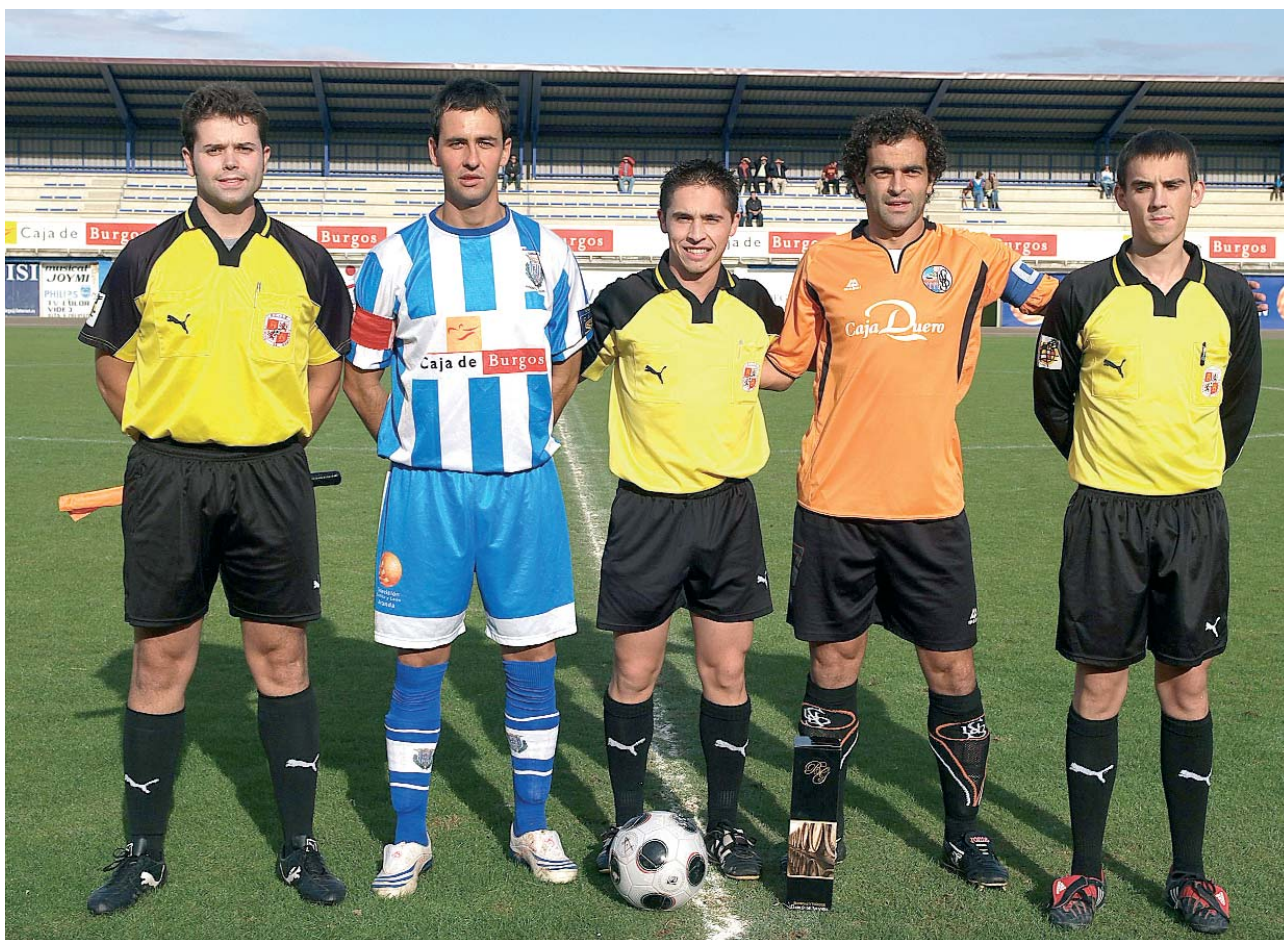
Capitanes de Arandina y Salamanca con el trío arbitral de semifinales

Sin embargo, el corto seguimiento, las goleadas excesivas o una escasa rentabilidad económica son las notas menos provechosas de este primer intento de organizar un torneo oficial en beneficio de los Clubes de Castilla y León.