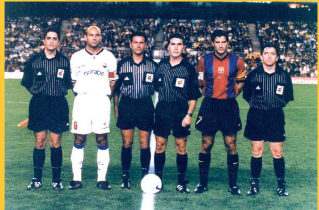
Debut en Primera, Extremadura - Barça 06/09/98