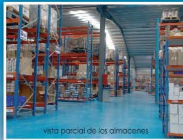
vista parcial de los almacenes