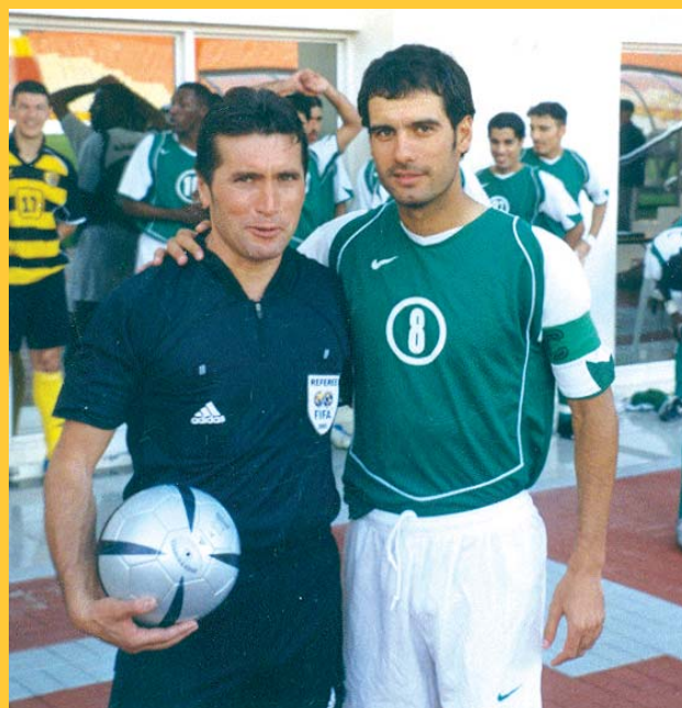
Final Copa SM El Rey en 2007 y con Pep Guardiola

- Arbitraje tecnológico: Pinganillo, ojo de halcón, bunker gol... // Todo avance que no destruya la