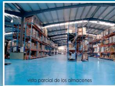
vista parcial de los almacenes