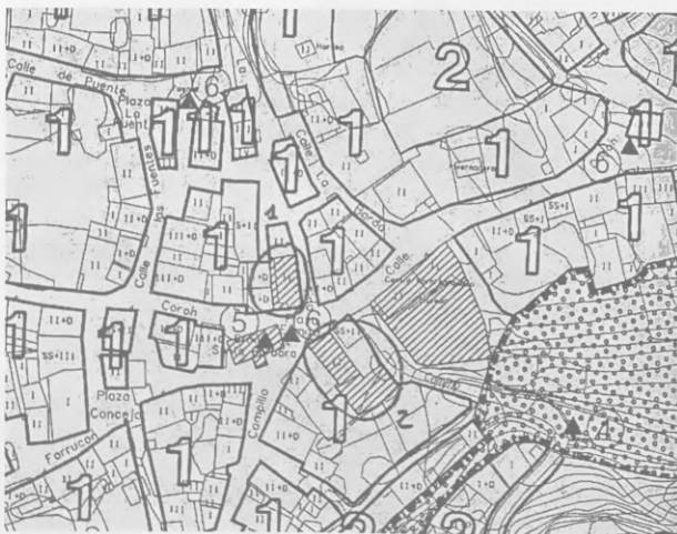
Figura 1: Parcelas desafectadas de calificación dotacional. Antiguo consultorio (1) y Antiguas Escuelas (2).

El siguiente esquema recoge la ubicación de las parcelas afectadas.