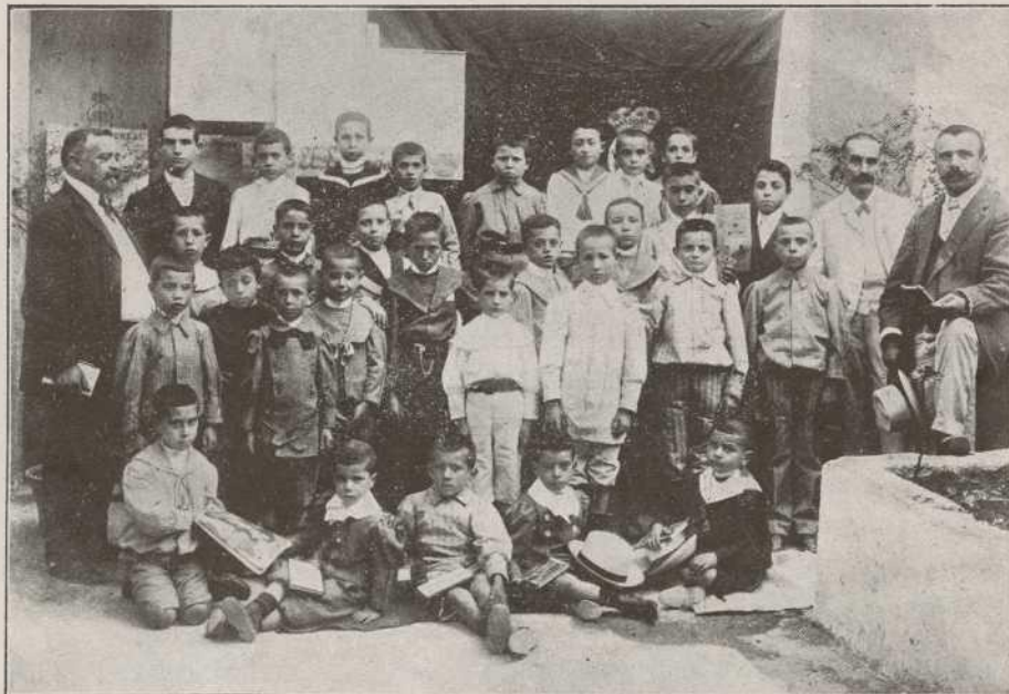
Grupo de niños pertenecientes a la 1. a Escuela nacional de Lluchmayor, cuyos escritos van apareciendo en EDUCACIONISTA.

El 31 de mayo de 1906 se verificó en Madrid el matrimonio de D. ALFONSO XIII con la princesa Victoria, y al regresar la comitiva a Palacio por la calle Mayor, hacia las dos y media de la tarde, desde un balcón fué arrojada a la carroza real una bomba, de cuyos estragos salieron los Reyes milagrosamente ilesos. Quedaron muertos varios soldados, guardias y oficiales que rodeaban la carroza, así como los caballos de la misma y numerosas personas. El autor del atentado, el malvado anarquis-