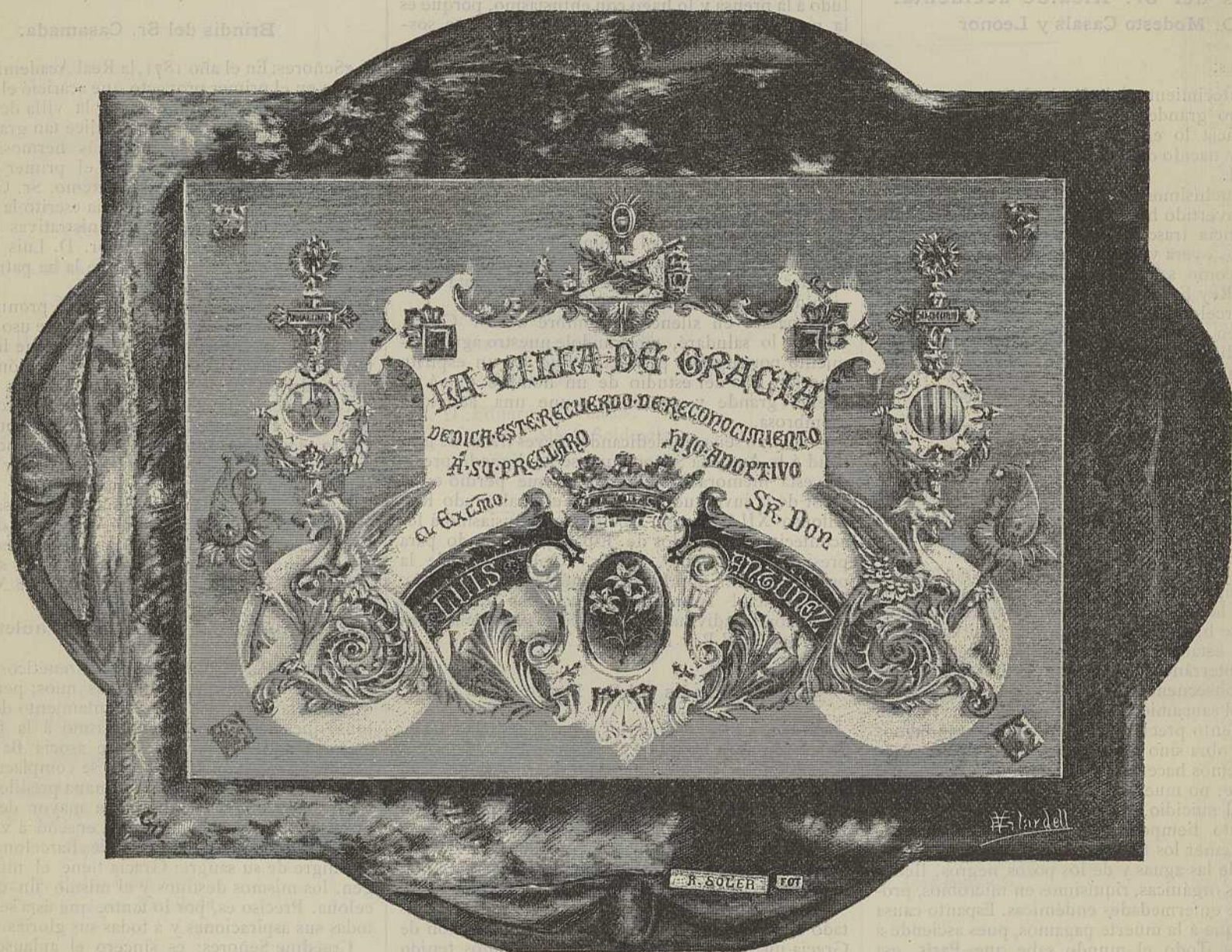
FACSIMIL DE LA PLACA REGALADA POR LA VILLA DE GRACIA AL EXCMO. SR. GOBERNADOR CIVIL DE LA PROVINCIA

Esta Señora, cuya preciosa existencia embarga la animosa solicitud é interés que le inspiran los espa-