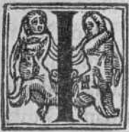
Vaticinium salubre Eze- chiae.

I n diebus illis. a ) Aegrotatio nis huius tempus inuesti- gandum est. Nam qualis fuerit Ezechiae morbus nō est cur anxie solicitemur.