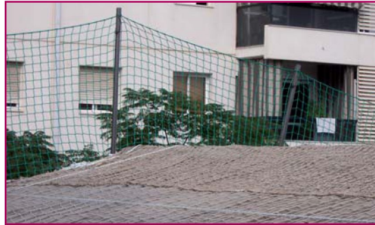
Red sobre cubierta

En cuanto a la elección y utilización de las redes de seguridad, el artículo 194 del IV CCGSC, nos señala que siempre que sea técnicamente posible por el tipo de trabajos que se ejecuten, se dará prioridad a las redes que evitan la caída frente a aquellas que sólo limitan o atenúan las posibles consecuencias de dichas caídas.