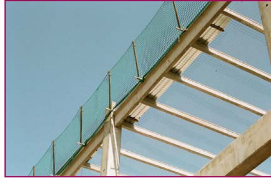
Red bien colocada

En el IV Convenio General del Sector de la Construcción (CCGSC) para el periodo 2007-2011, se establecen las normas de obligado cumplimiento, que regulan en su artículo 172 de forma concreta las protecciones contra el riesgo de caídas de alturas.