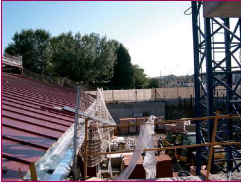
Red mal colocada

tiva, tales como barandillas, plataformas o redes de seguridad. Si por la naturaleza del trabajo ello no fuera posible, deberá disponerse de medios de acceso seguros y utilizarse cinturones de seguridad con anclaje u otros medios de protección equivalente.