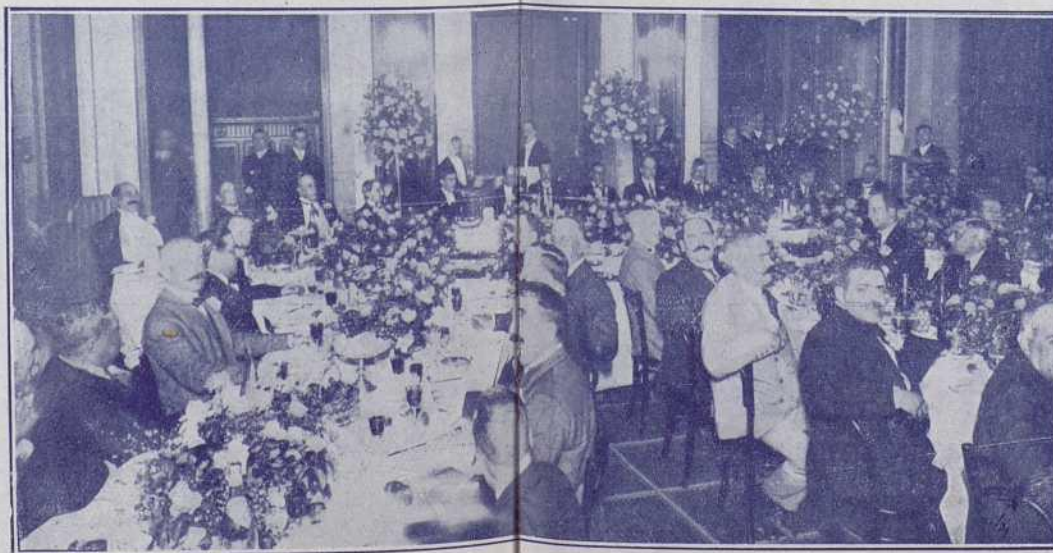
Banquete con que Joselito invitó a sus amigos como despedida de soltero.