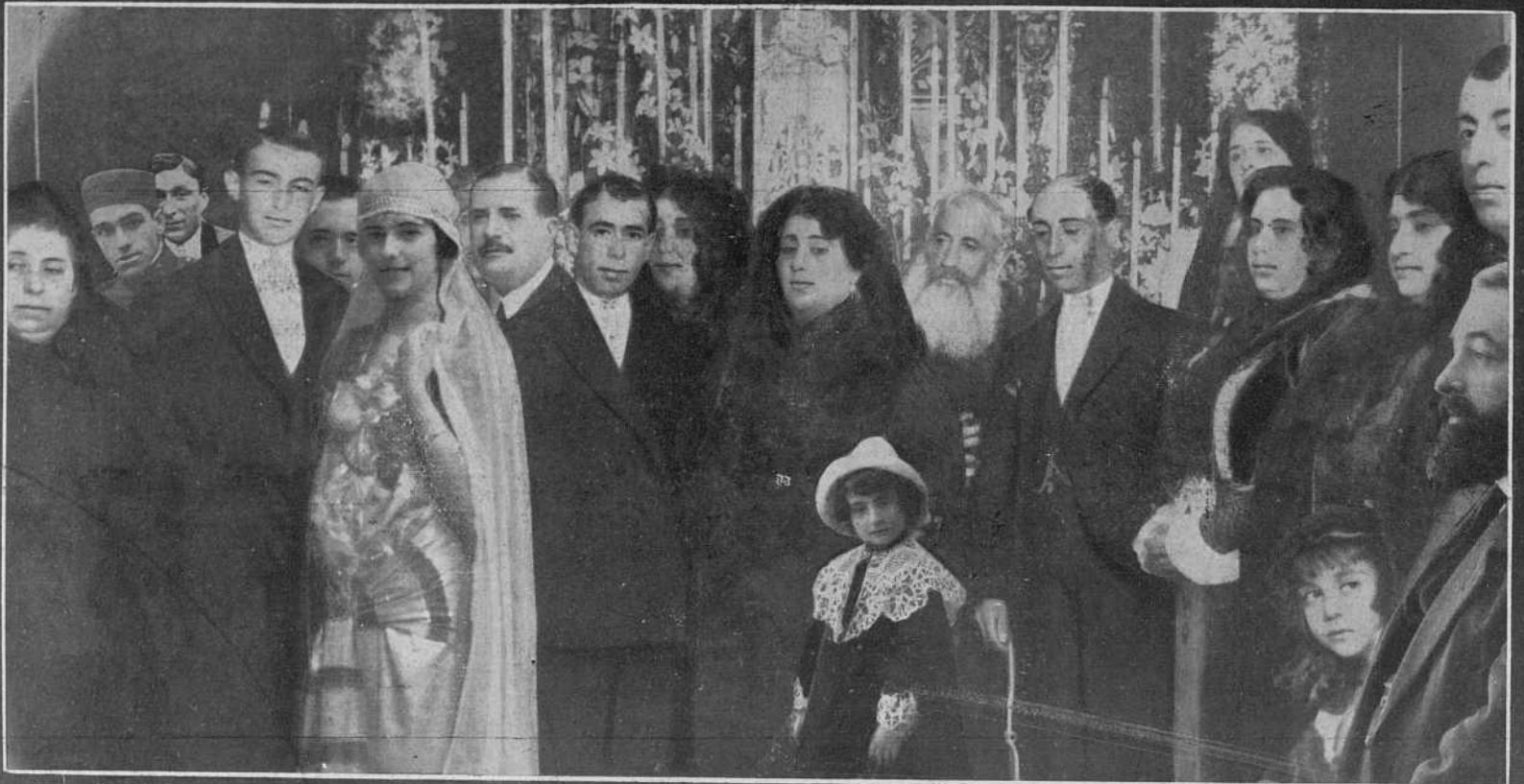
Los novios y el acompañamiento saliendo de la capilla después de la boda.