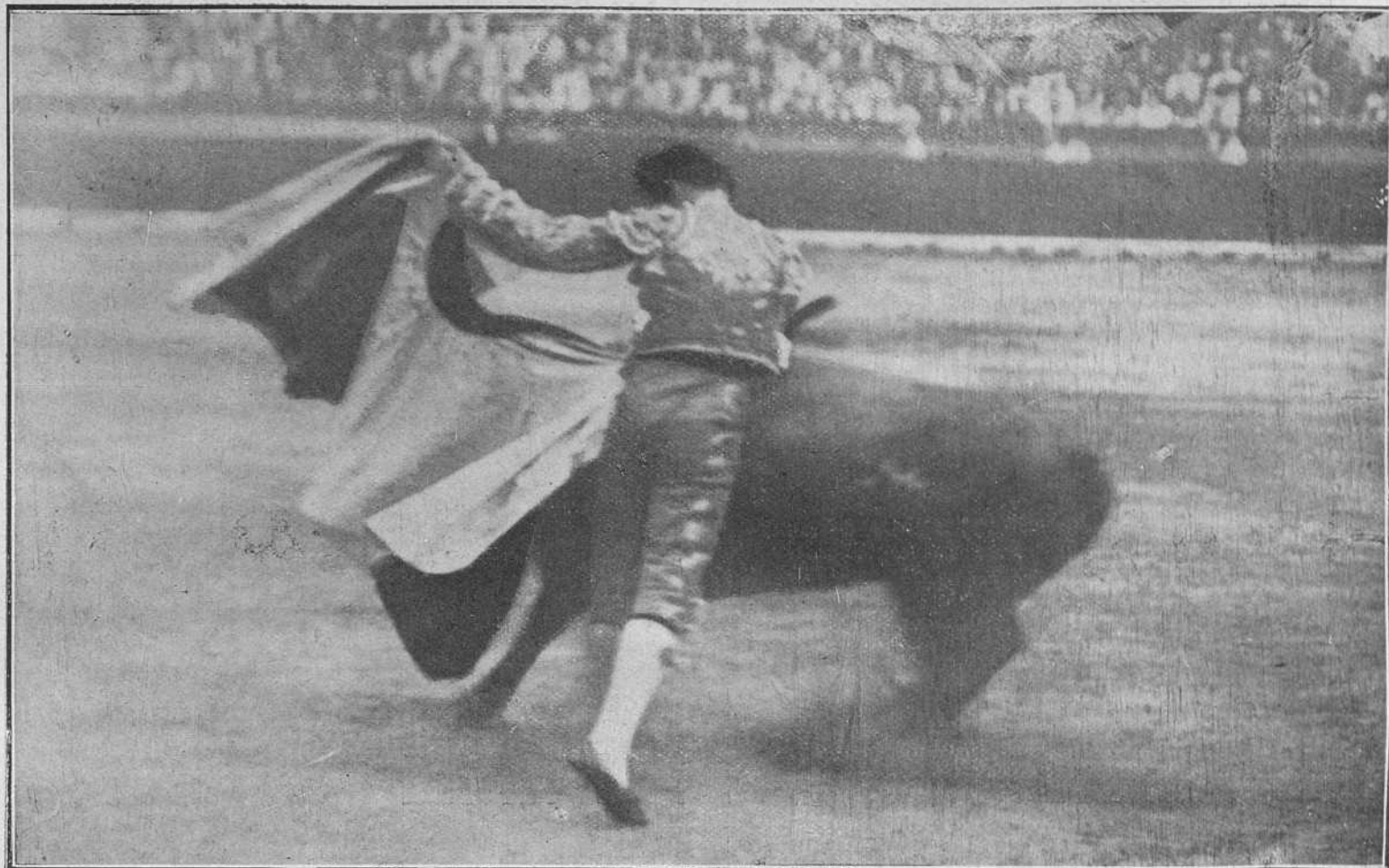
UNA GRAN VERONICA DE JOSELITO