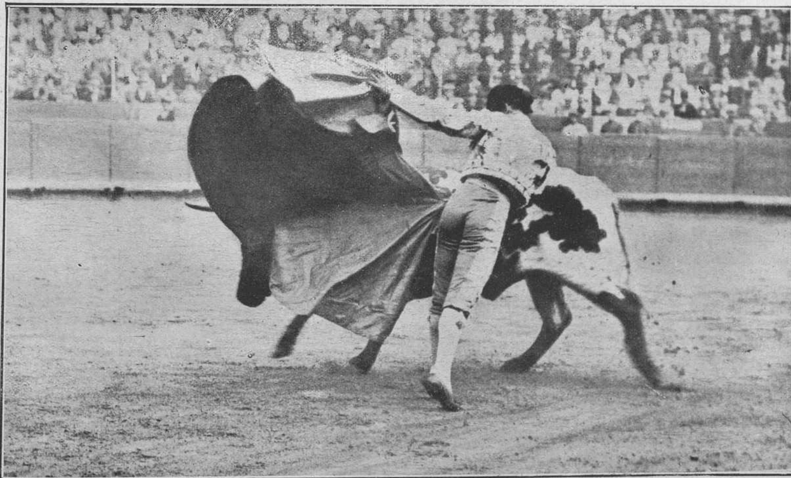
EL TRIANERO DIBUJANDO SU PREDILECTA SUERTE