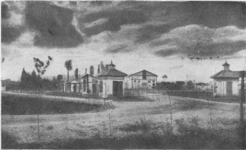
GRANJA - ESCUELA (PABELLONES)

Como resultaría largo reseñar aunque fuese sumariamente las actividades y trabajos de esta institución, honra de los leoneses, dejamos para otra oportunidad este importantísimo asunto no si antes felicitar a las autoridades y personal del establecimiento, por su patriótica e importante labor, digna de todo respeto y encomio.