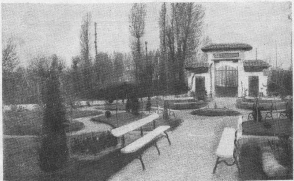
GRANJA - ESCUELA (JARDINES)

En el establecimiento hay también un plantel de sementales de diversas razas selectas, de los animales más importantes en la provincia, que se proporcionan a los criadores en condiciones muy liberales a fin de que todos puedan refinar sus ganados sin desembolso ninguno.