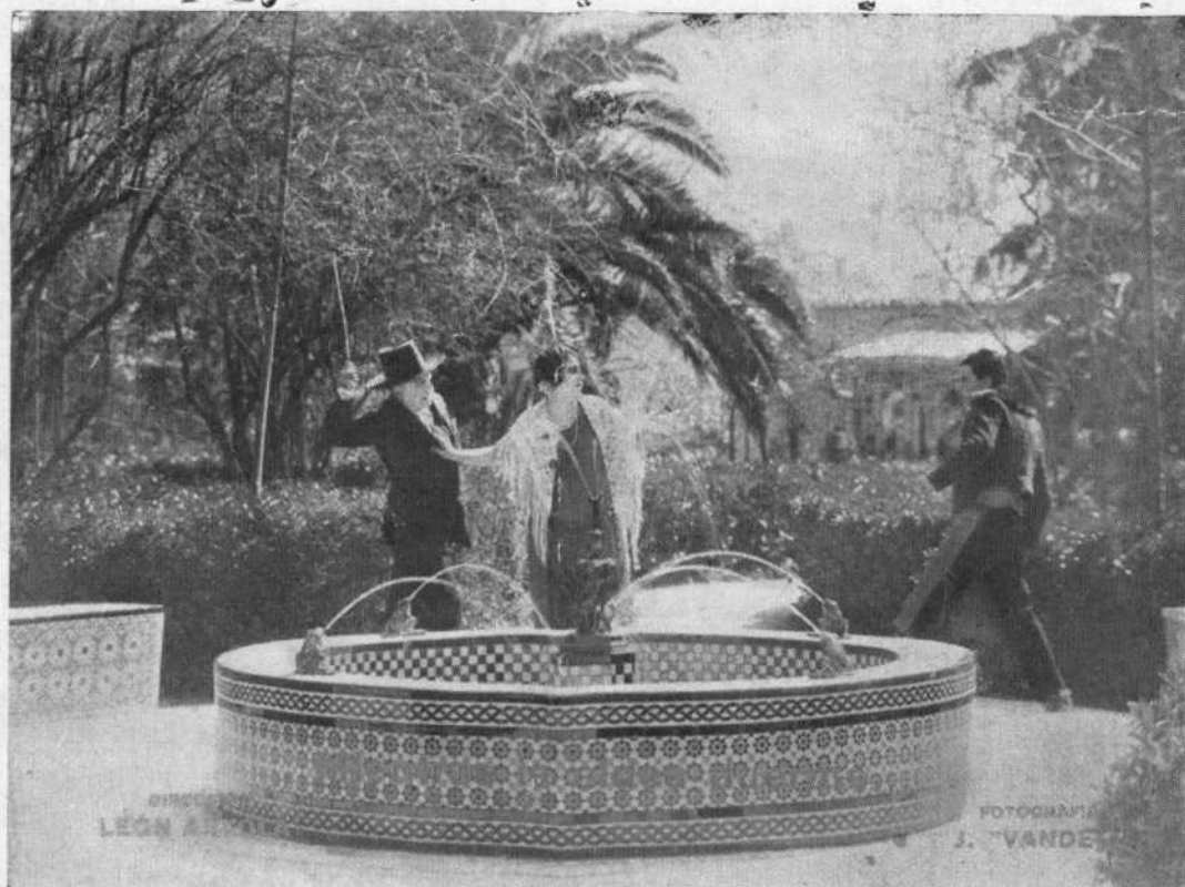
"Cuando la Aldea Duerme" Belísima escena de la película del Sr. Artola.

Por otra parte, la obra de las comisiones directivas, por muy eficaz que fuese, resultaría trunca e inconclusa,