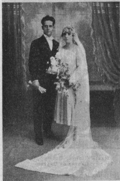
LOS DESPOSADOS DESPUES DE LA CEREMONIA