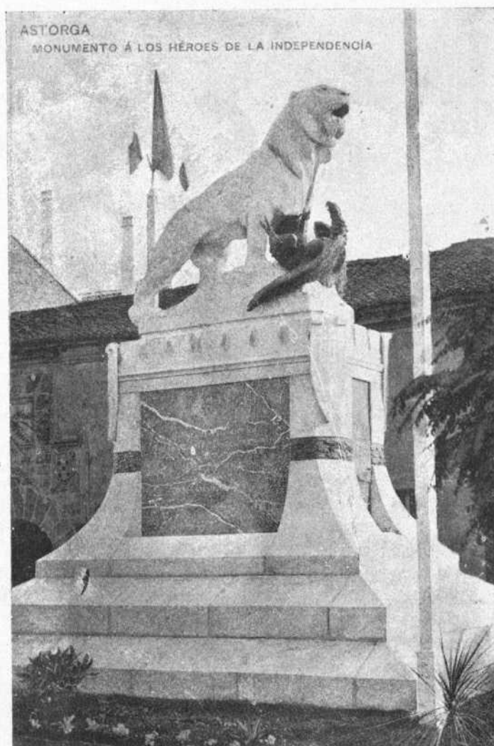
ASTORGA. — MONUMENTO A LOS HEROES DE LA INDEPENDENCIA

Organo oficial de la Asociación CENTRO REGIÓN LEONESA