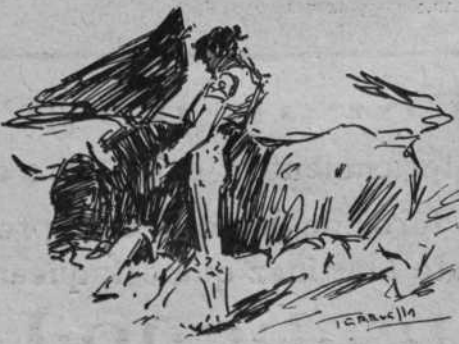
"Palmeño" parando con la muleta