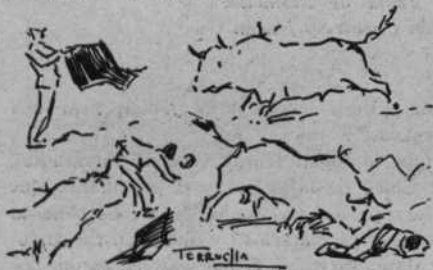
Cogida del espontáneo de turno