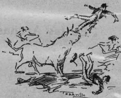
Un buey con cabeza, que hace andar de cabeza