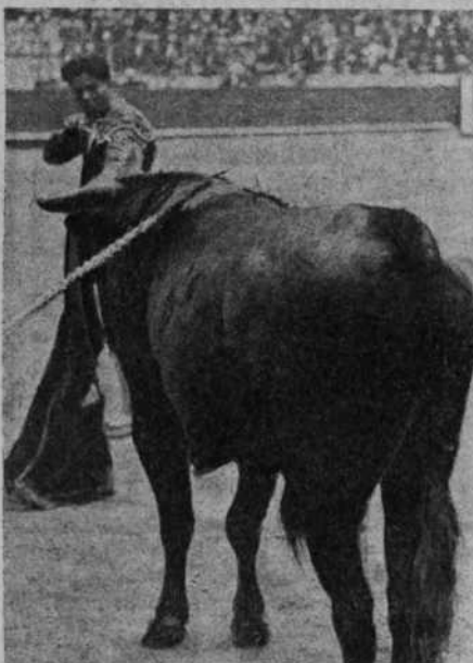
Palmeño entrando a matar al que cerró plaza

llegado a hacerse una figura muy estimable como subalterno, quiso volver a probar for-