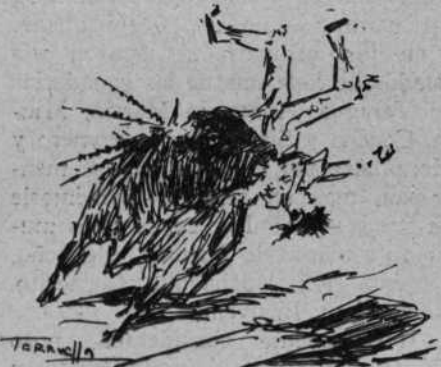
Aparatosa cogida de "Nili"

Eso pudo cantarse de los tres muchachos que apachugaron con la corrida de Urcola y que nos dieron una tarde de toros