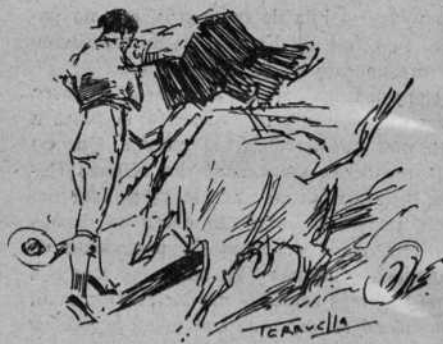
El de Caracas en un magnífico muletazo

do a cabo una faena superiosísima por naturales y de pecho, con mucho valor y maneras de buen torero. La faena se amenizó con música, y cuando ya el éxito estaba logrado, por confiarse demasiado fué empuntado al rematar un pase resultando con una