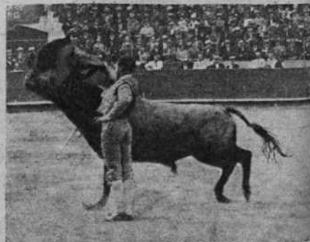
Julio Mendoza en un enorme muletazo