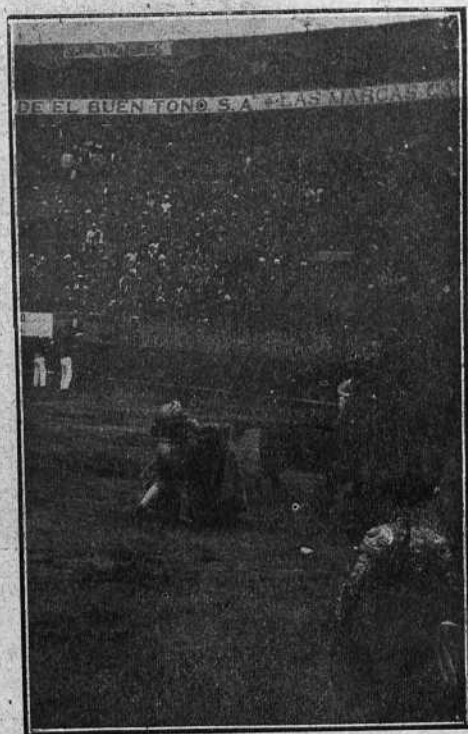
MONTES EN UN QUITE AL CUARTO TORO

Toma este diestro los palos de motu proprio y deja un par al cuarteo bien colocado; le sigue