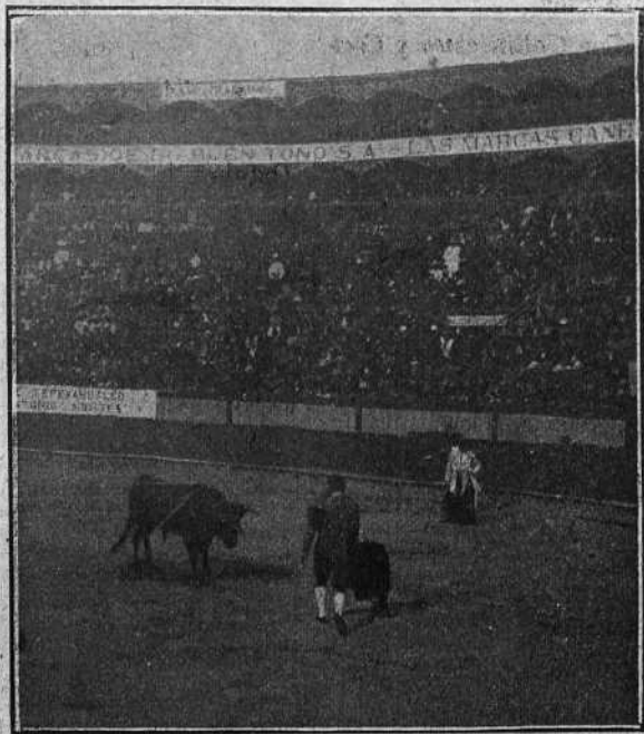
«PARRAO» EN EL PRIMER TORO

Primero. Negro listón, meano, bien colocado