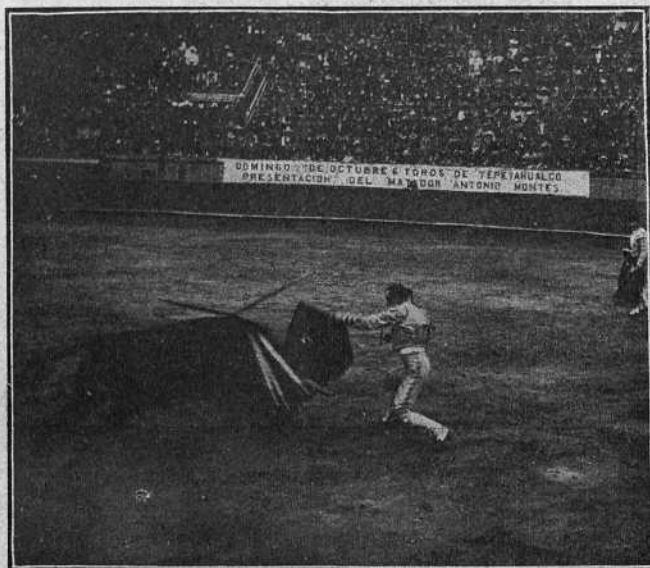
MONTES PASANDO DE MULETA AL CUARTO TORO

corremos, seis toros con la bravura de los lidiados hoy, entusiasman al lucero del alba; el primero cumplió en varas, se quedó en banderillas y acabó su existencia defendiéndose; voluntarioso fué el segundo, y llegó al final algo quedado; el tercero fué un buen toro: bravo y de poder en el primer tercio, acabó su vida derrochando nobleza; el cuarto fué voluntarioso en varas y noble en los otros tercios; el quinto acudió también con voluntad á los montados, y no presentó dificultades después; finalmente cerró plaza otro buen toro, que comenzó la pelea con bravura y poder,