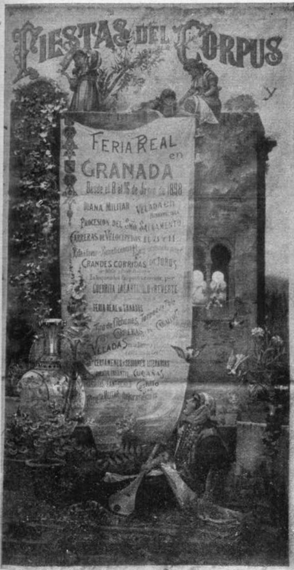
Cartel de las fiestas.

Figuraos aquellas cuestras silenciosas, oscuras—pendientes como camino del abismo,—de pronto iluminadas por teas y hachones con bengalas rojas, blancas, azules, verdes, y al fulgor de estas luces la bandada que se deslizaba por ellas de mujeres hermosas, realizadas por gasas, sedas, flores y