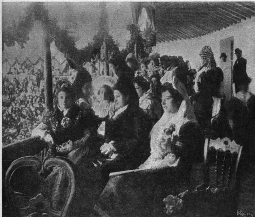
Aspecto de los palcos.

Debido á la actividad de nuestro inteligente corresponsal fotográfico en dicha población, podemos hoy ofrecer á nuestros lectores las preciosas instantáneas que ilustran estas líneas, en las que se aprecian distintamente el conjunto que presentaba la plaza, descollando entre la numerosa y brillante concurrencia, el donaire y la belleza de las mujeres, que son gala y orgullo de la localidad.