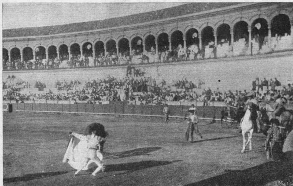
Faico en un quite al primer toro.

Dejaré á la empresa en entera libertad de acción, sin recargar la nota censurable, que bien cas-