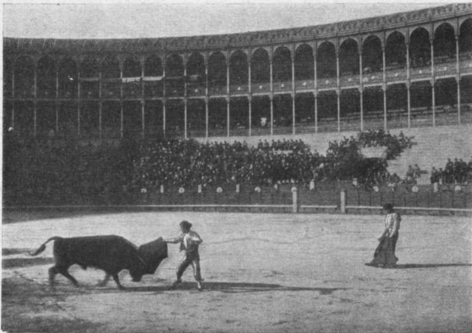
Lagartijillo pasando de muleta á su primer toro.

No es que Lagartijillo no tenga condiciones que le hacen muy recomendable, y Fuentes no sea