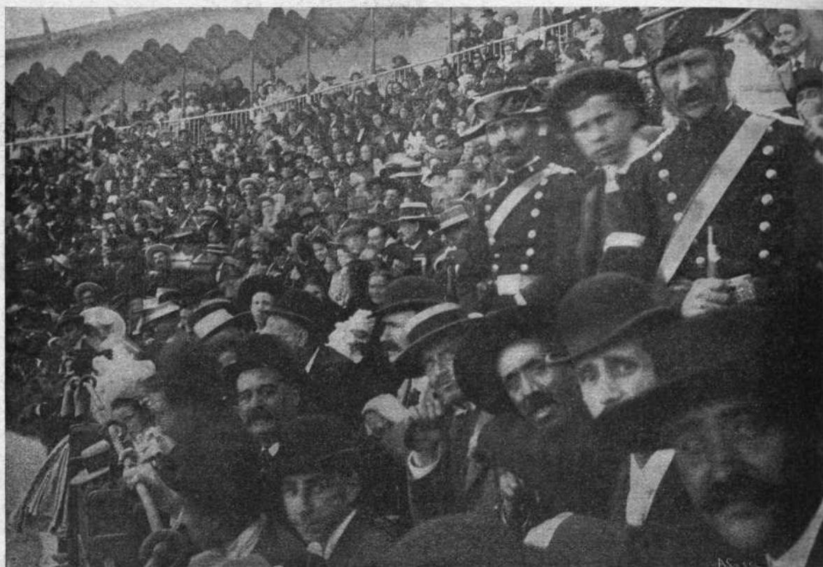
Vista de un tendido de sombra.

En suma: una fiesta muy animada, de la que los aficionados de Baeza conservarán gratos recuerdos.