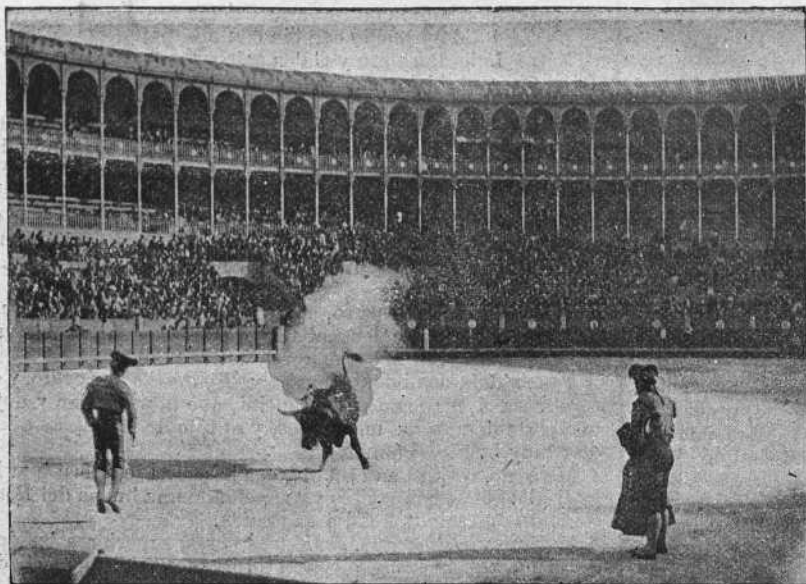
«Barquero» después de colgar un par de fuego al segundo toro.

Logroño 22. —El ganado de Miura, bien criado y bravo, fuera del segundo y primero, por ese orden, que tenían malas intenciones, no tan malo de lidiar como se creía. El último, casi buey; pero en general, ha gustado mucho y ha resultado una buena corrida. 44 varas, 15 caídas y siete caballos arrastrados, acusan los apuntes.