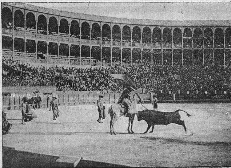
«El Chato» en un puyazo al primer toro.