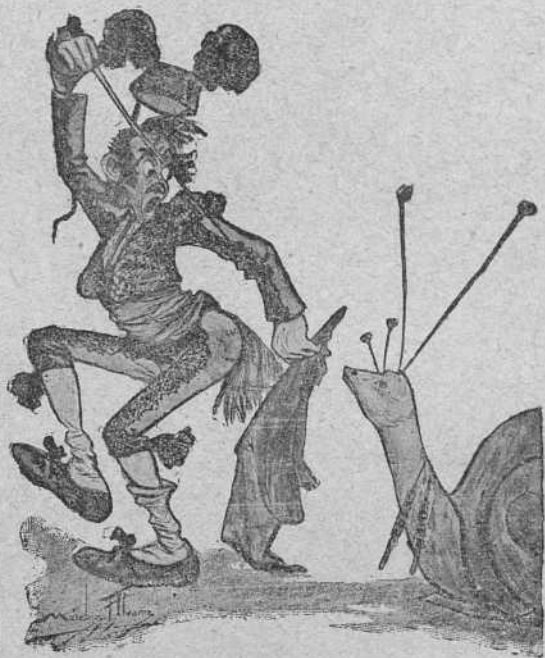
Desahogo, mil... y pico, Jauja.