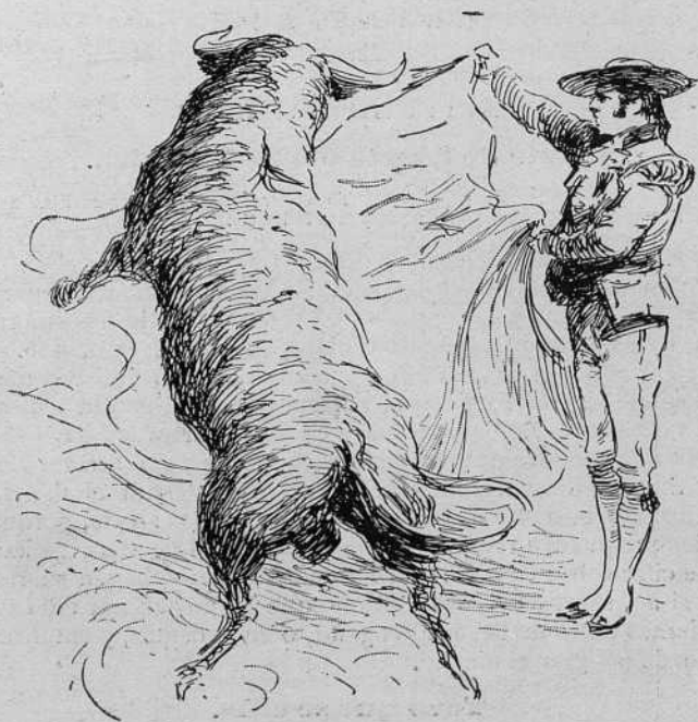
Suerte de frente a la Verónica. !

cerca, conforme las piernas que le advierta al toro, y luego que le parta le empezará a cargar y tender la suerte, con cuyo quiebro el toro se va desviando del terreno del diestro,