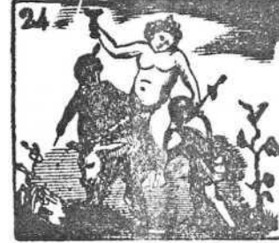
Baco, con poder divino, es el protector del vino.