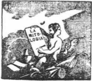
Adoraron los gentiles dioses y diosas á miles.