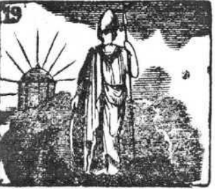
Minerva, con gran poder, es la diosa del saber.