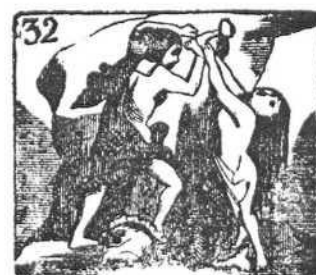
A Andrómeda, Perseo libra del monstruo más feo.