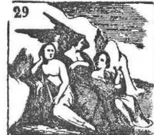
En el mar fueron encanto las Sirenas con su canto.