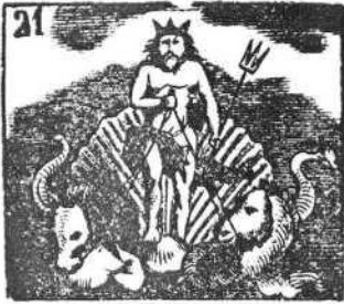
Neptuno sabe ordenar el vasto imperio del mar.