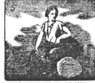
En Ceres, la agricultura tiene diosa de hermosura.