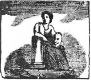
El verso Talia mide, y la comedia preside.