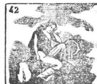
El gentil no halla baja en dar culto á la Pereza.