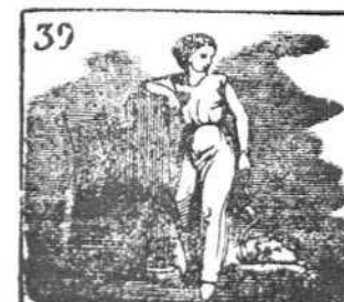
También culto de deidad tiene la Fidelidad.