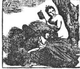
Es Venus de diosas diosa, de todas la más hermosa.