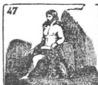
El dios Odin gobernaba la nación Escandinava.