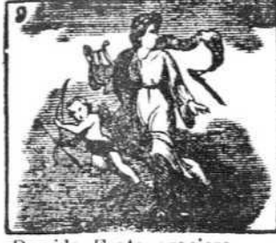
Preside Erato graciosa la poesía amorosa.