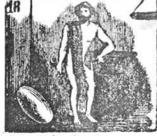
Es en el culto pagano el dios del fuego, Vulcano.