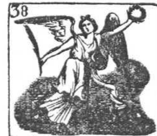
La Victoria el mundo entero corre con vuelo ligero.