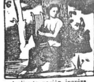
Ardiente pasión inspira de Apolo la dulce lira.