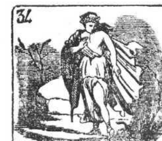
Euridice fué amante, esposa fiel y constante.