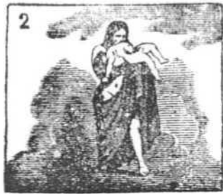
Cruel, viejo y taciturno, le pintan al dios Saturno.