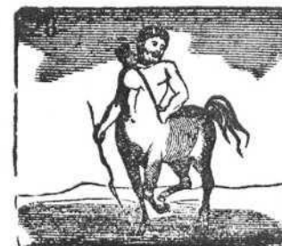
Inventor del calendario fué Quirón ó el Sagitario.