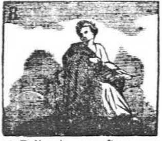
A Polinnia se confía la heroica poesía.