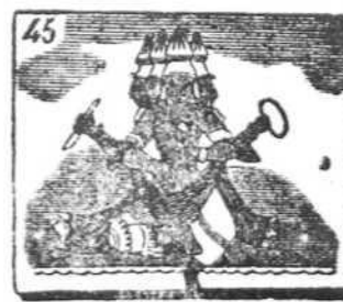
Señor creador se llama el dios de la India, Brahma.