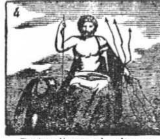
De los dioses, el primero es Júpiter justiciero.