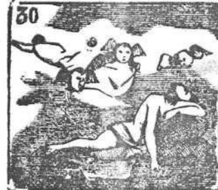
De todo viviente dueño es Morfeo, dios del sueño.