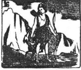
Diana, casta doncella, es diosa discreta y bella.