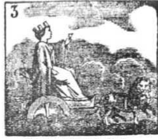
Cibeles, la fortaleza simboliza y la pureza.