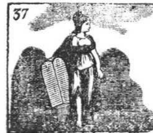
La Libertad diosa era de figura altiva y fiera.