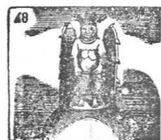
En la mejicana tierra, Tlaloc fué dios de la guerra.