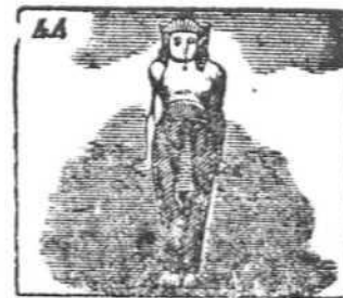
El numen llamado Fes un dios del Egipto fué.