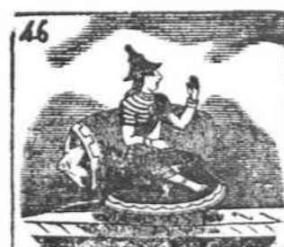
Tiene en la India poder Rambla, diosa del placer.