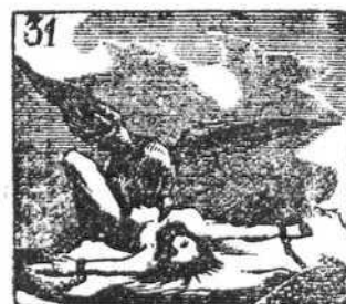
Prometeo es castigado por Júpiter irritado.