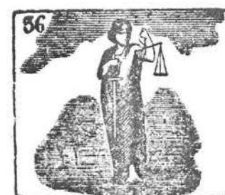
En el alto firmamento la Justicia tiene asiento.