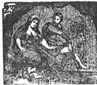
En el infierno domina Plutón junta á Proserpina.