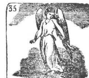
En Grecia la Fama era de los dioses mensajera.