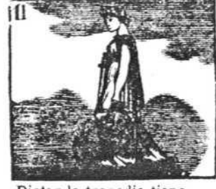
Diotar la tragedia tiene á su cargo Melpomene.