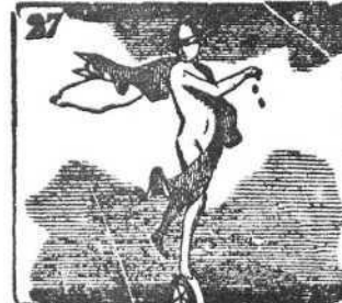
La Fortuna veleidosa recibe culto de diosa.