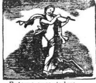
Euterpe encantadora de la música es señora.