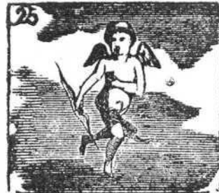
Del corazón es señor Cupido, dios del amor.