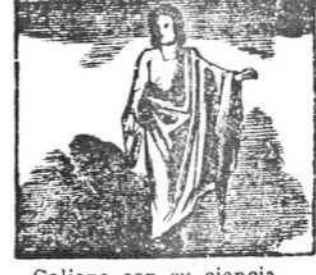
Caliop con su ciencia es rusa de la elocuencia.