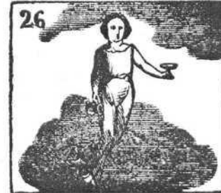
Hebe fué por su virtud diosa de la juventud.