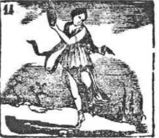
Protección de diosa alcanza en Terpsicore la danza.