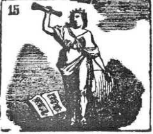
Acertadamente guía Urania la astronomía.