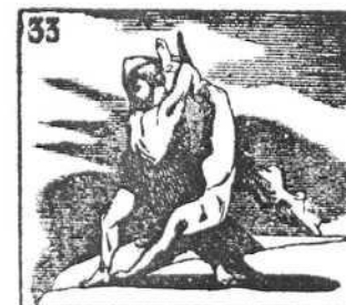
Hércules el invencible fué poderoso y temible.