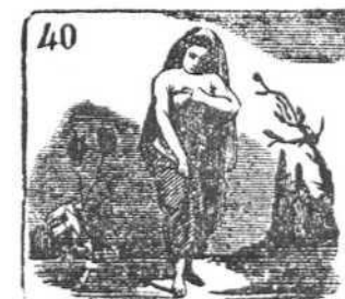
Pueblos que gentiles fueron al Pudor culto le dieron.