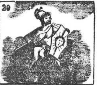
El dios invencible Marte guía de la guerra el arte.