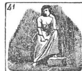
Quien los vicios diviniza á la Envidia simboliza.