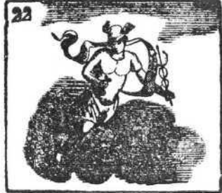
El dios Mercurio, sin trono, es del comercio patrono.