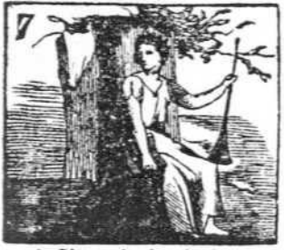
A Clio cabe la gloria de presidir en la historia.