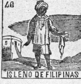
ISLENO DE FILIPINAS