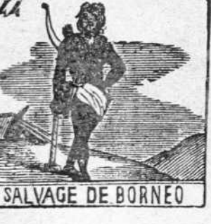
SALVAGE DE BORNEO