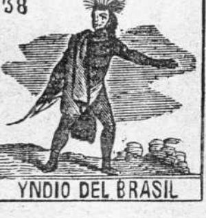
YNDIO DEL BRASIL