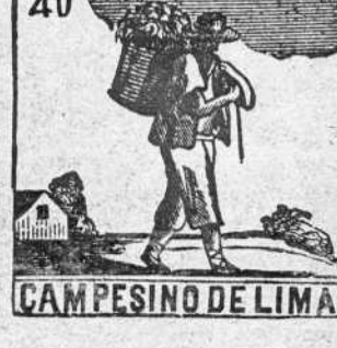
CAMPESINO DE LIMA