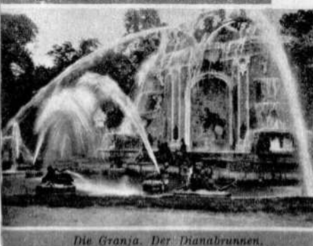
Die Granja. Der Dianabrunnen.

könnte. Die Burg ist ein starker Widerschein dieses Landes; denn Schloss heisst auf spanisch «castillo» und Kastilien ist Castilla. Castilla ist also das Land mit den vielen «castillos». Segovia spielte eine hervorragende Rolle im Krieg der Comuneros , die in der Stadt einen ihrer hauptsächlichsten Stützpunkte hatten. Die Erinnerungen an diese Kämpfe zeigen sich häufig in den interessanten Strassen Segovias. Man hätte eine bessere Bühne dafür nicht finden können.