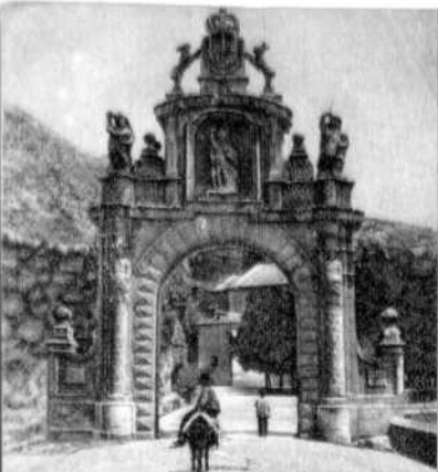
Bogen von der Fuencisla.