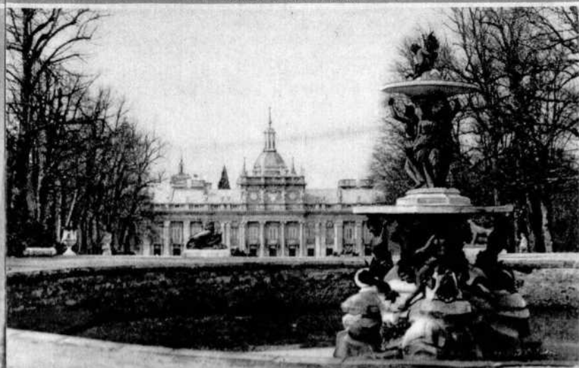
Palast in der Granja.