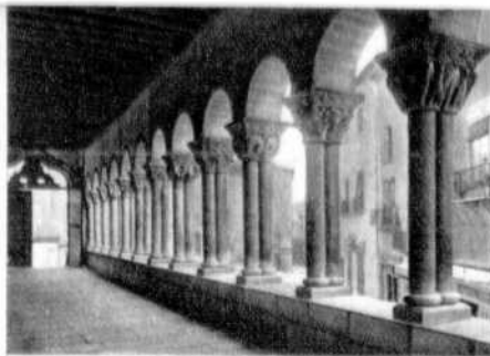
Kreuzgang von San Martin.

LA GRANJA. —Das Dorf San Ildefonso , mehr bekannt unter dem Namen « La Granja », ist einer der schönsten und angenehmsten Plätze, die der Tourist