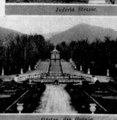
Gärten der Granja.