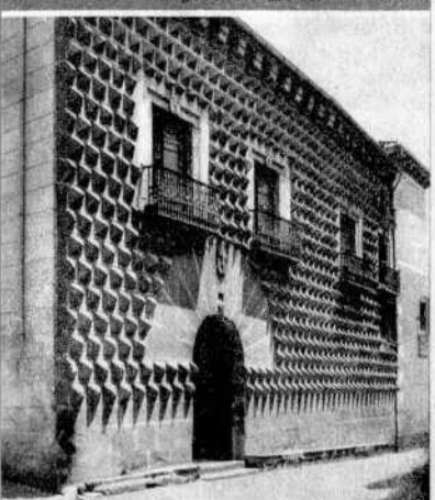
Haus der Picos.