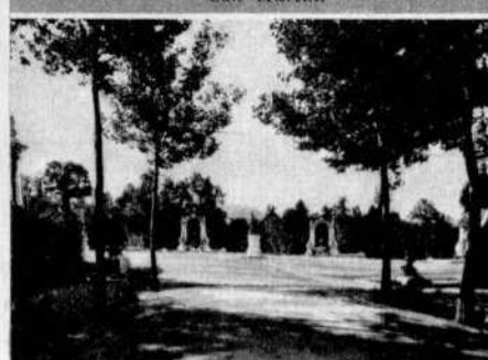
Die Granja. Die acht Strassen.

besuchen kann. Hier vervollständigen sich die Schönheit der gebirgischen Landschaft mit der französischen Kunst, und der erste der spanischen Bourbonen, Philipp V., schuf hier etwas, was an Versailles erinnert und vielleicht auch erinnern sollte.