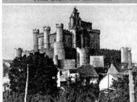
Schloss von Turégano.