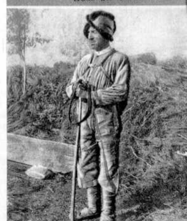
Hirte im Gebirge.