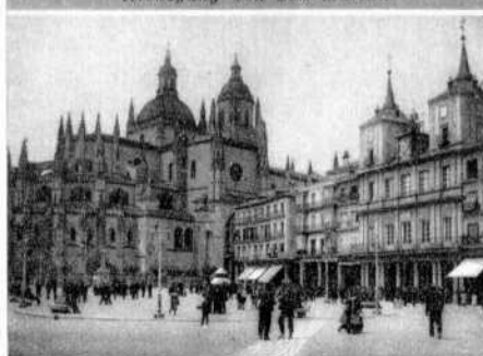
Plaza Mayor und Kathedrale.