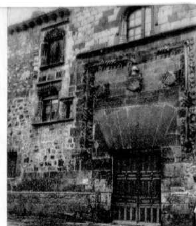
Haus der Ramires.

Was in den Gärten der Granja besonders anzieht, sind die Springbrunnen, berühmt durch das graziöse ihrer Wasserspiele. Es gibt 26 monumentale Brunnen, nicht gezählt die vielen anderen, die diesen besonde-