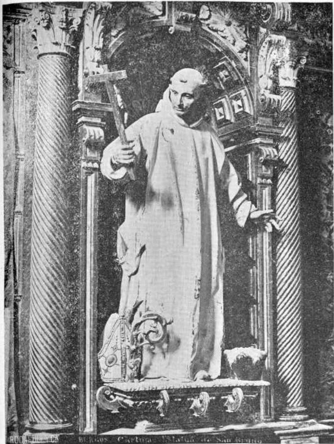
BURGOS; ESTATUA DE SAN BRUNO DE LA CARTUJA DE MIRAFLORES