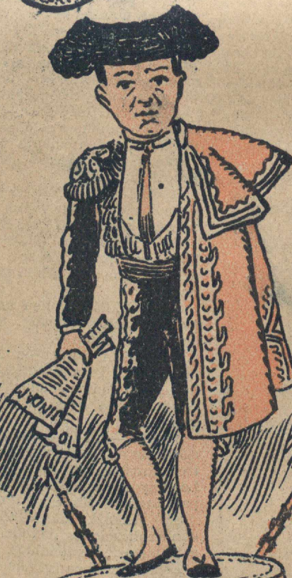
Lema: Si aciertas quien es... te llevas... QUINTO.