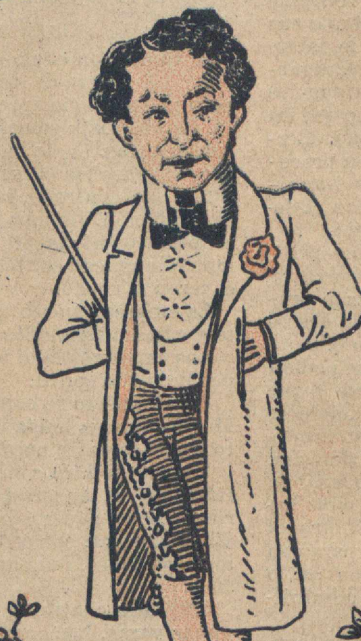
Lema: "The Camelo Sportman"