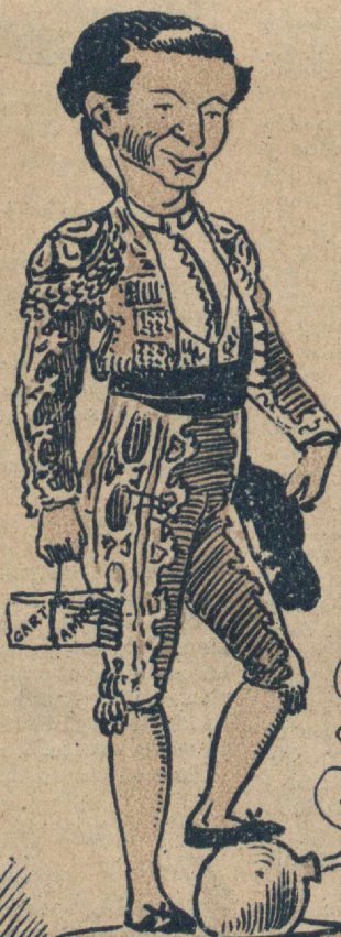
Lema: ¡Ole por el físico !!...