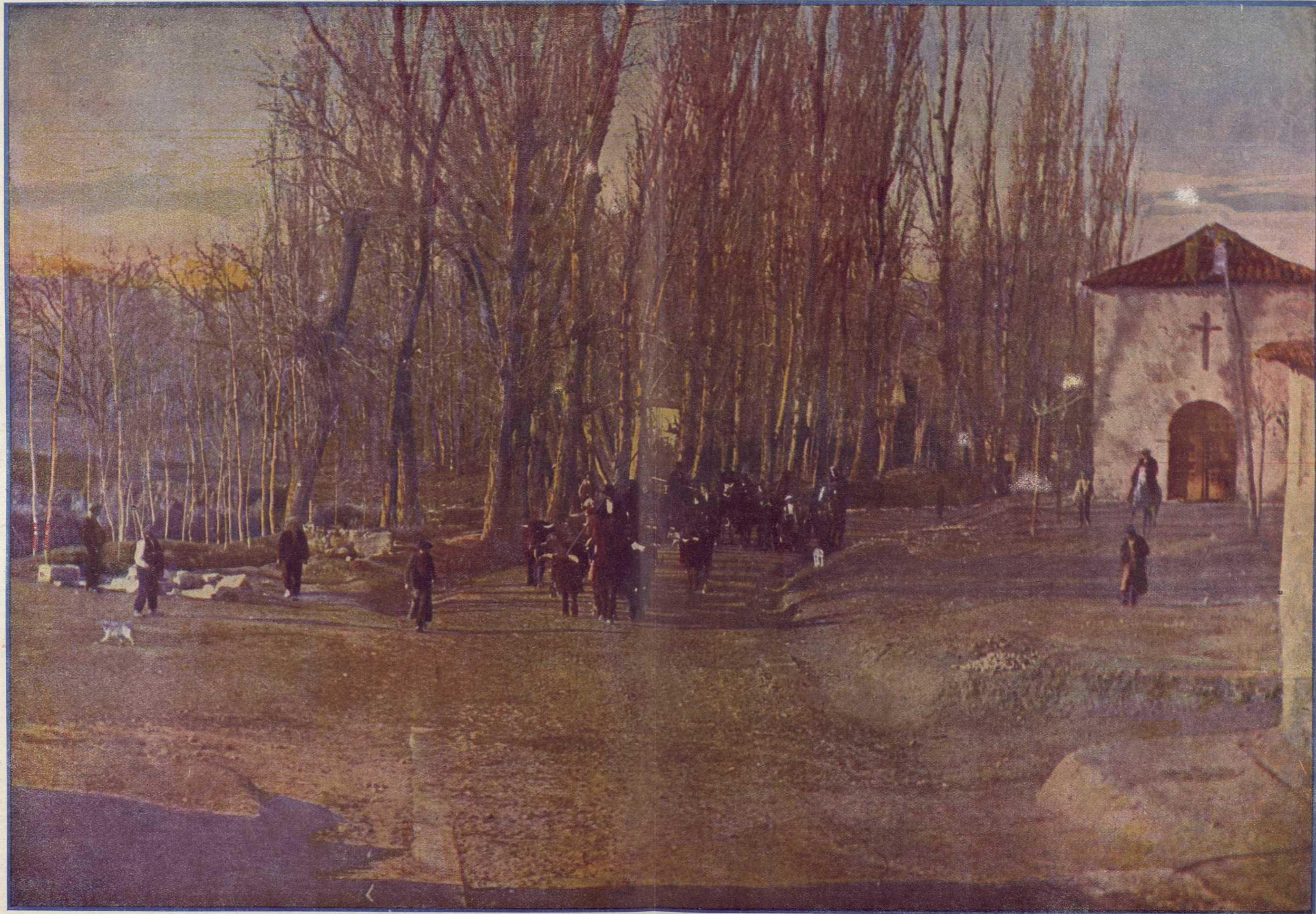
Un encierro en Romanones (Guadalajara).