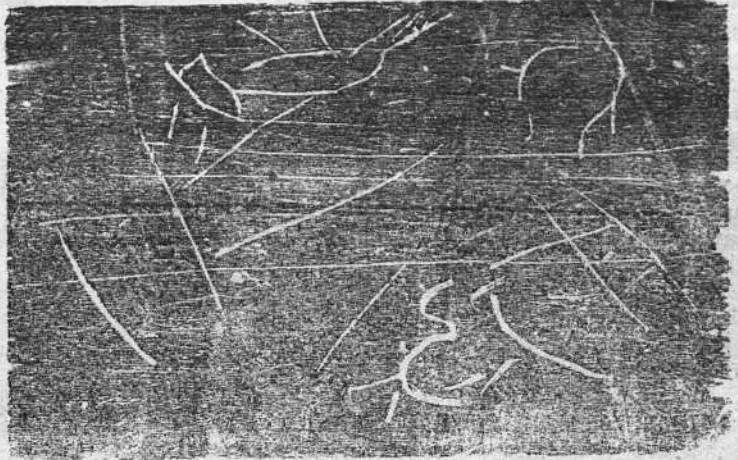
EL DUENDE DE LA COLEGIATA en la incógnita dehesa del señor Vega

¿No ven ustedes nada? Pues es el mismo "cliché" que publicó el "Heraldo" días pasados. La fotografía está bien... ¡Sólo que es de noche y todos los toros son negros!