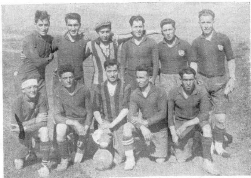
EL TEAM DE FOOT-BALL QUE DEFIENDE LOS PRESTIGIOS DEPORTIVOS DE SANTA LUCIA (LEÓN)

Organo oficial de la Asociación CENTRO REGIÓN LEONESA