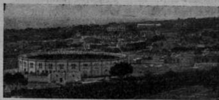
Vista general del tauródromo de Santa Cruz de Tenerife