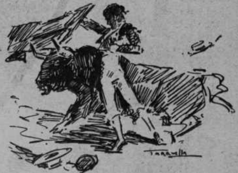
Un muletazo del bravo "León de Riela"