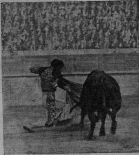
"Gitanillo" con un valor temerario rematando un quite de rodillas

En su segundo, uno de los dos berrendos "Mugos" se limitó a estar valiente. No cabía otra cosa. Con la muleta hubo un momento que pareció que nos íbamos a alegrar; pero no hubo "de qué".