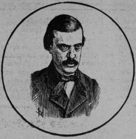
VI MANUEL FERNANDEZ Y GONZALEZ

M adrileño neto y amarrado por fuerza irresistible a la Villa y Corte, don Federico Minguez fue un taurofilo de abolengo, pues el autor de sus días era un aficionado tan rabioso por las corridas de toros, que dicen que a verlas y comentarlas dedicó lo menos una tercera parte de su vida. Procuró inculcar a su