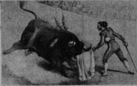
Antonio Ruíz "El Sombrerero" toreando de muleta (De una estampa de la Historia de el toreo de Bedoya)

Los odios entre negros y blancos se llevaban a las plazas de toros; en las mismas cuadrillas existían enconadas disidencias; los toreros no se movían