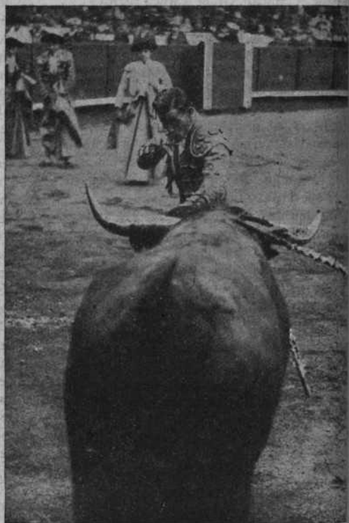
Aldeano, perfilado para matar a su primer toro

lucidamente. Con la espada, a pesar de extrañar algo de largo, arrancó siempre derecho. Se le aplaudió mucho, y el público salió