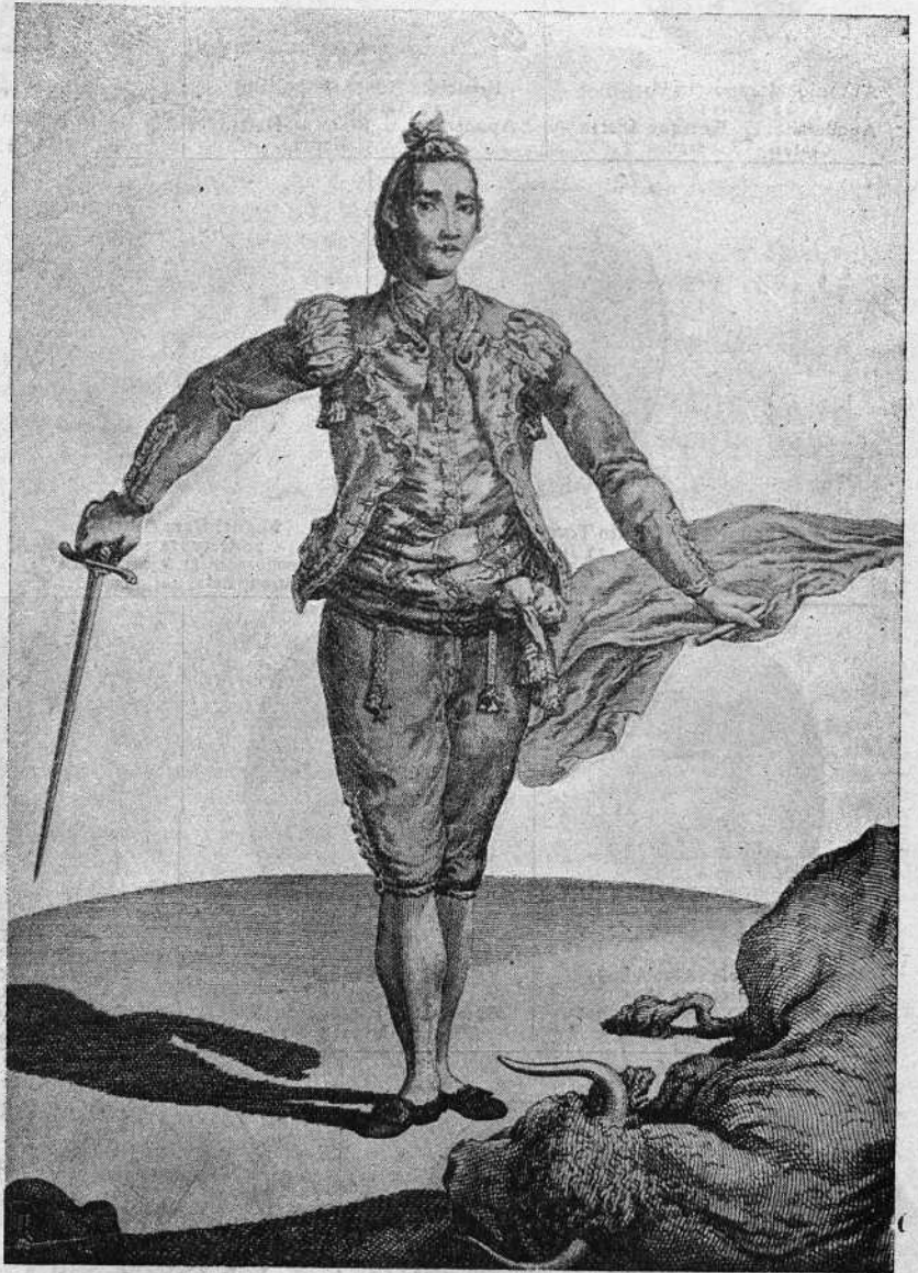
Joaquín Rodríguez (Costillares)