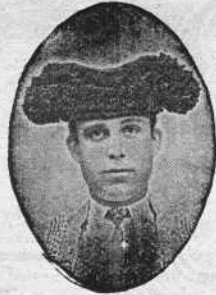
Rafael Guerra (Guerrita) 27 Setiembre 1887 Capuchinos, 10, Córdoba.