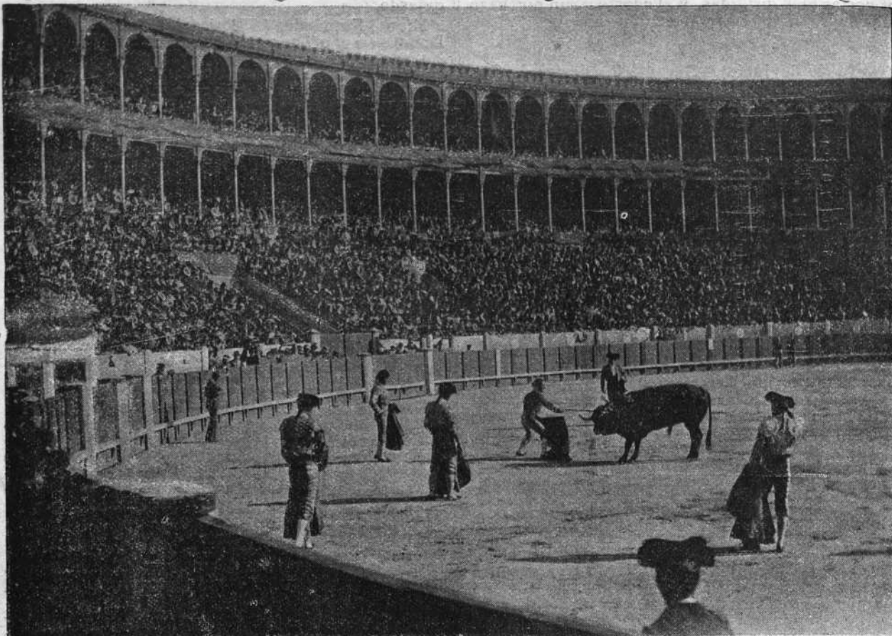
La gartijillo intentando el descabello al segundo toro de la corrida de Beneficencia, Carasucia , de doña Celsa Fontfrede, viuda de Concha Sierra.

muleta, y cumplió su cometido con una estocada un poco caída, entrando bien y saliendo por la cara.