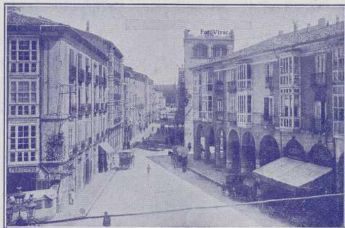
BURGOS: Calle de Santander.