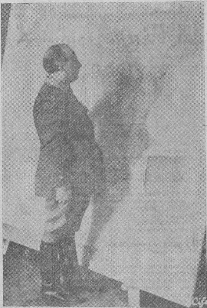
El Caudillo, estudia sobre el mapa de operaciones, la marcha de la guerra en los diversos frentes, en los días gloriosos de la Cruzada salvadora, desde su Cuartel general del pascio de la Isla

Conviene hacer la historia de estos reconocimientos, hoy que la marejada sojuzga la lucha de los españoles por su libertad y por su autodeterminación.