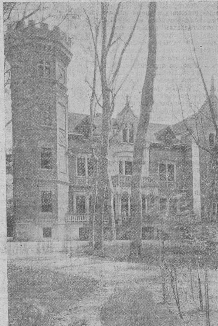
La Residencia de S. E. el Jefe del Estado en nuestra ciudad, desde donde Franco condujo a sus soldados a la victoria total contra los enemigos de España