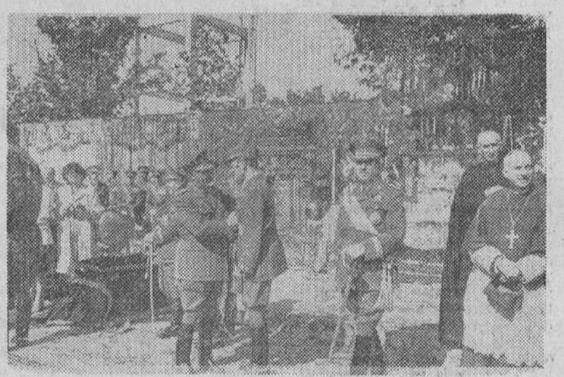
El Caudillo condecora a un héroe de la Cruzada, en un reciente acto celebrado en Madrid

Soldadas gloriosas de España condecorados por el Caudillo